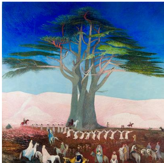
Zarándoklás a cédrusokhoz Libanonban

Csontváry művészetéről vallott nézeteinek az egyik legfontosabb gondolata az „élő természet” problémája. Önéletrajzából tudjuk, hogy már gyermekkorában szenvedélyesen érdeklődött a természeti jelenségek iránt. Az élő természet más és más formában ugyan, de megtalálható valamennyi képén. A furcsán gyűrődő sziklaalakzatokban, a felhők szárnyas formáiban, a vizesések zubogó vízfűgönyében, a dombok, hegyoldalak mozaikszerűen összepréselt színfoltjaiban, a merészen rövidülő terekben, a szokatlanul görbült, de mégis új dimenziók felé utat nyitó személyes, egyéni perspektívában.