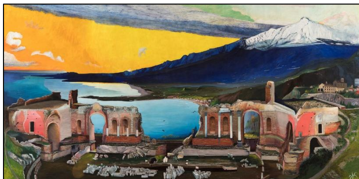
A taorminai görög színház romjai