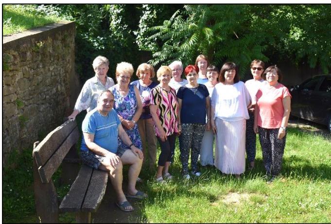
Alkotók egy csoportja

A XVIII. Lábatlani Alkotótábor és Művésztelep 2023. július 3–16 között került megrendezésre az Arany János Alapfokú Művészeti Iskola napközi épületében (Rákóczi út 126.). A nyári alkotótábor nyitott, bárki bárhonnán jöhetett, de most is elsősorban a helyi és a környékbeli érdeklődőket vártuk. A tábor elsődleges célja: a képzőművészetek (festészet, grafika, szobrászat), valamint a fotóművészet iránt felkelteni az érdeklődést, felfedezni tehetséges embereket, és lehetőséget nyújtani abban, hogy a gyakorlatban is kipróbálják magukat a művészet különböző területein. A másik fontos cél: az együtt alkotás öröme, a szabadidő értelmes eltöltése, a szunnyadó értékek felszínre hozása, a közösségépítés, és mindezzel hozzájárulni a város kulturális életéhez, művészi értéket létrehozva formálni és segíteni a közízlést.