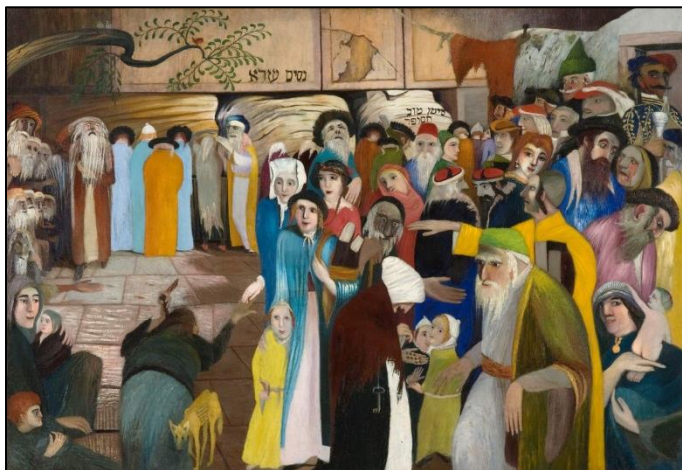
A Panaszfal bejárata Jeruzálemben

A tárlat a művész első olajfestményével, az 1893-as Pillangókkal indul, melyekkel egy térben az „iskola előtti tanulmányokként” ismert madárképeket láthatja a közönség. Ezek aprólékos megfestése és eleven színessége már a pályakezdő festő-patikus technikai jártasságát érzékeltetik. Csontváry művészi pályafutásának fontos fordulópontját jelentette a Hollósy Simon müncheni rajziskolájában eltöltött fél éves időszak 1894-ben. Müncheni tanulmányait érzékeny modellrajzok dokumentálják, amelyek külön szekciót képeznek a kiállításon. A kiállításon ezek mellett helyet kapott Csontváry első figurális festménye, az 1894-es Almát hámozó öregasszony című alkotása is.