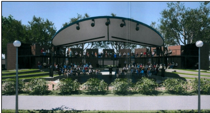
A tervezett beruházás. A kép illusztráció

A Duna-part organikus fejlesztése, a város és a Duna kapcsolatának erősítése, a turisztikai vonzerő, a kulturális lehetőségek javítása érdekében az Emberi Erőforrások Minisztériuma két elnyert -más célra nem fordítható- pályázati forrásból megújul a part meghatározott szakasza és 280 fő befogadására alkalmas közösségi tér és színpad épül.