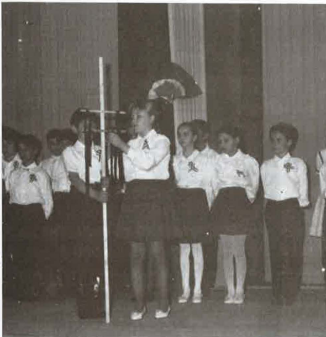
A 13 aradi vértanú emlékére egy szál gyász szalag emlékeztetett.