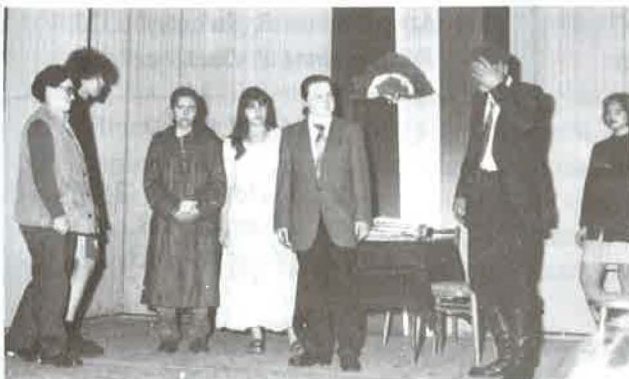
A Klub 8 tagjai az előadás közben igazi mókás karakterek.