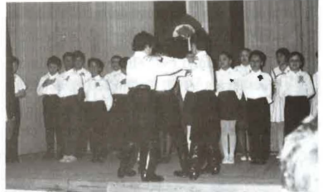
„Most szép lenni katonának...” szöveg a Kossuth nóta.