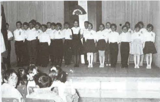
A kórus melyre épülten figyelt a szép számú közönség.

A KLUB 8 Színjátszócsoport Kern András: Csöröge az álparaszt című vígjátékát adta elő nagy sikerrel. Kíváncsian várjuk a következő előadást.