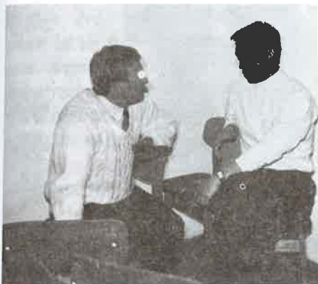
Orbán Viktor és a főszerkesztő interjú közben