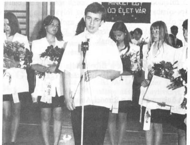
Búcsúzik a 8. osztály