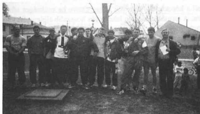
A verseny résztvevői