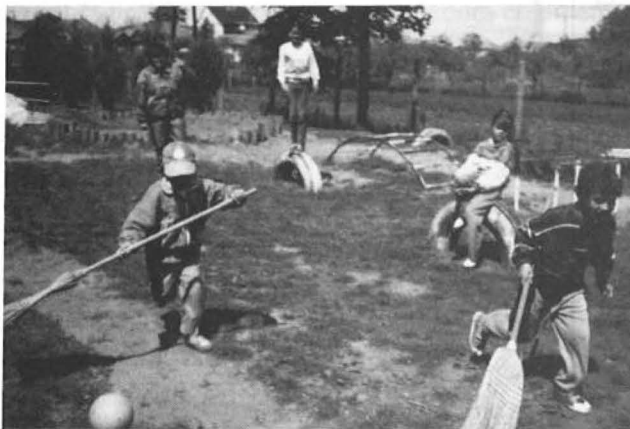
Az óvodában sportnap keretében rendezték meg az idei ballagást. A szülők is és gyerekek is egyaránt jól érezték magukat.