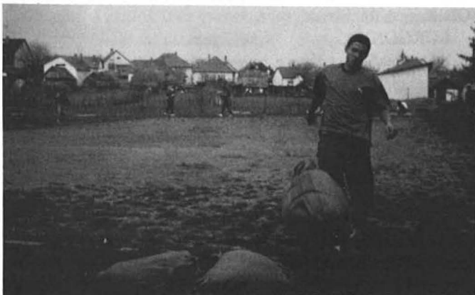
Nehéz volt az 50 kg-os zsákkal futni a salakon

Képeink előző számunkból kimaradtak, mert lapzárta után érkeztek, s most ezt pótoljuk.