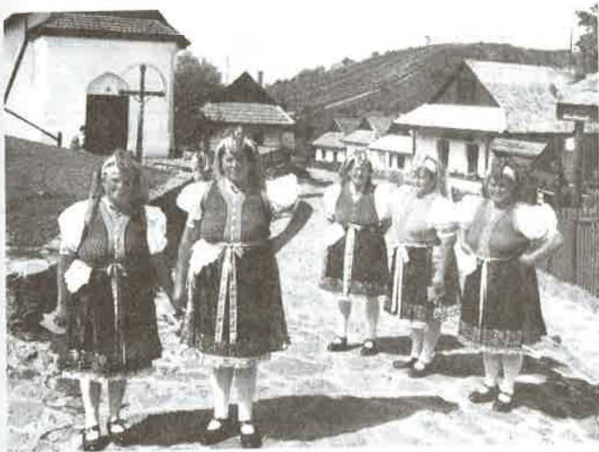
Népviselőbe öltözött asszonyok a faluban