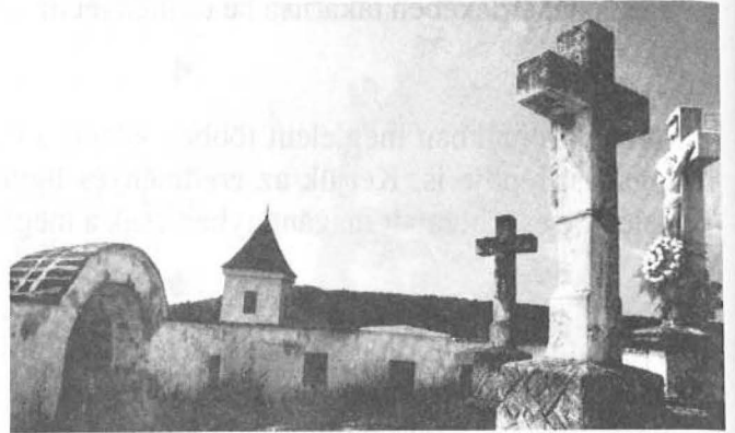
A Kálvária-hegyen épült a Szent Anna kápolna