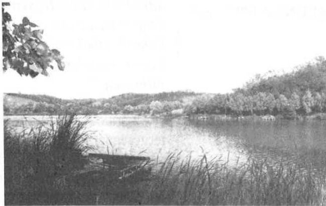
Mesterségesen alakították ki a Kétdobonyi tavat, ami népszerű horgászvíz

mány szerint Rákóczi Ferenc 1710-ben a község szélén álló dombról irányította a romhányi csatát. A falu evangélikus temploma 1792-ben épült, barokk stílusban. Oltárképe a Munkácsy Mihály féle Golgota egyik részletének másolata. Az Andreánszky-kúria a XIX-dik század elején épült, klasszicista stílusban. A falu határában elterülő Kétdobonyi-tó ismert és népszerű horgászvíz.