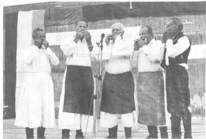
Meghívott vendégeink is színvonalas műsort adtak elő