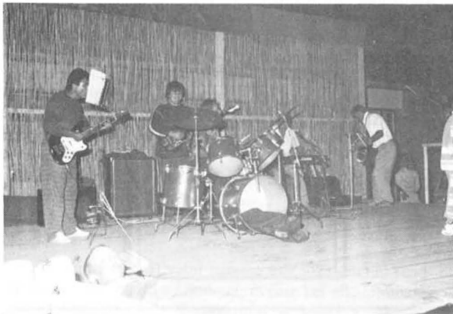
19-én este a rimóci zenekar húzta a talpalávalót.