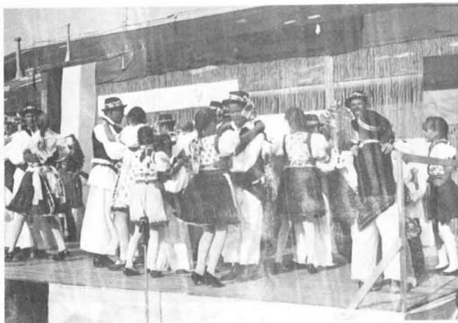
A fiatalok fergeteges tánca.