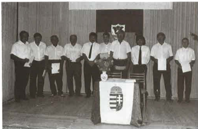
A rimóci rezesbanda