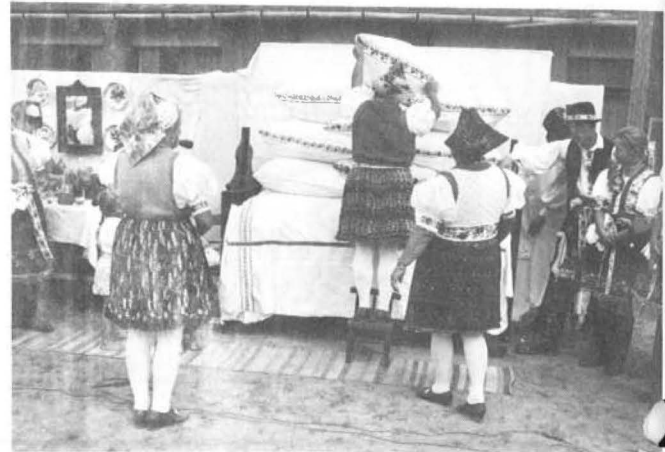
Így vetik a menyasszony ágját Rimócon.