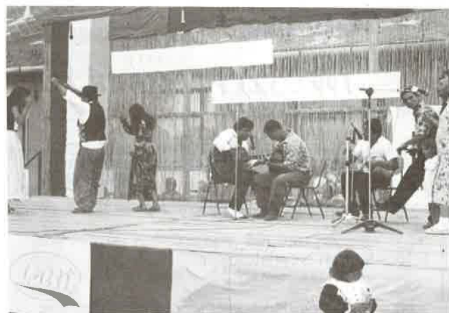
A rimóci kisebbség előadása is hangulatos volt.