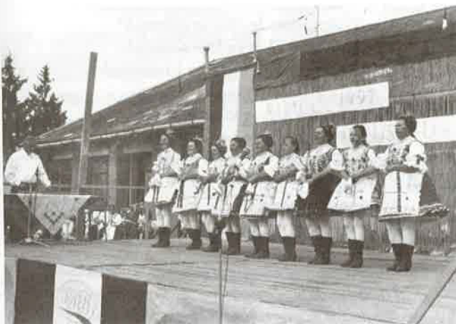
Megcsodálhattuk a bujáki népviseletet is.