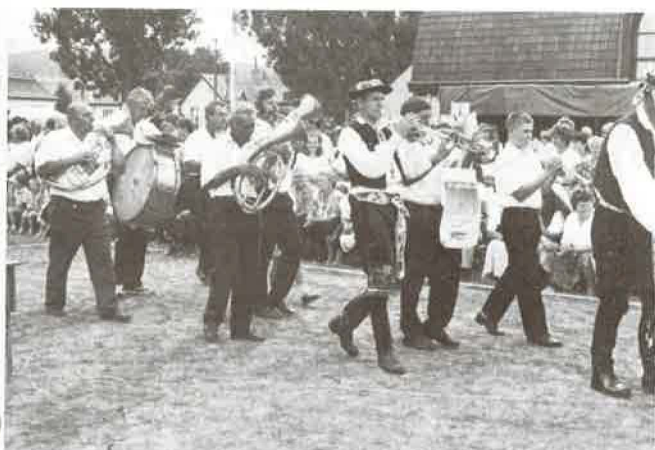
Bevonul a rezesbanda