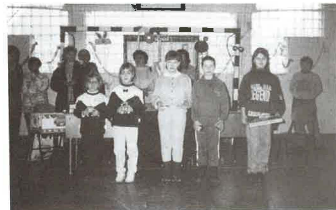
A jelmezbál díjazottai jelmez nélkül