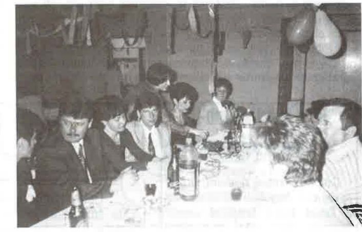
A bál résztvevői