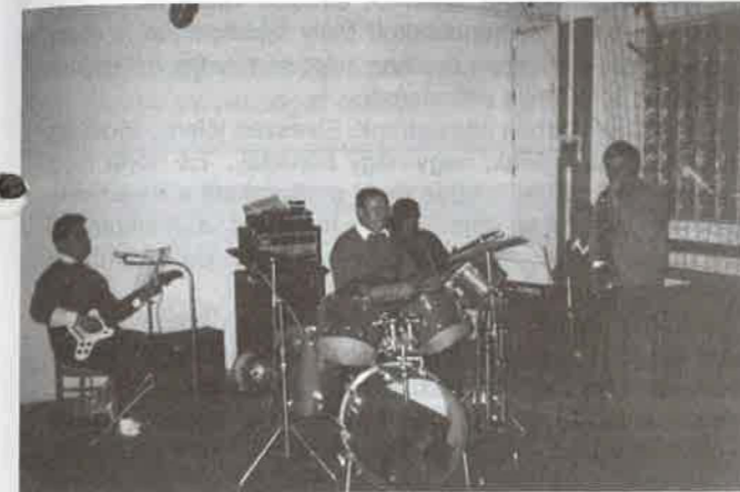
A hangulatos zenét a rimóci zenekar szolgáltatta

A bál, amellyel, hogy nemes célt szolgált, hajnalig tartó, remek szórakozási lehetőséget is adott. A hangulat remek volt, amit képekben szeretnénk bemutatni olvasóinknak.