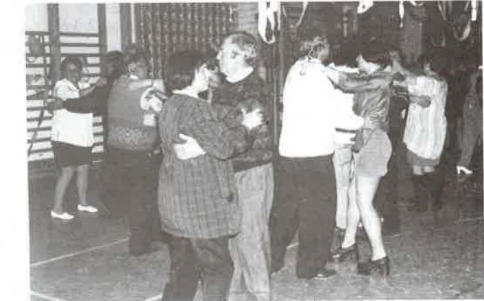
Hajnalban is ropták a táncot