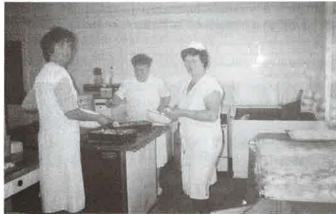
Készül a farsangi fánk az óvodában.