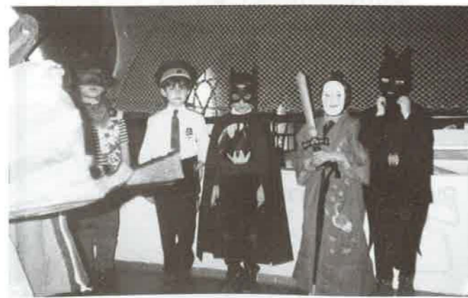
Néhányan a jelmezesek közül