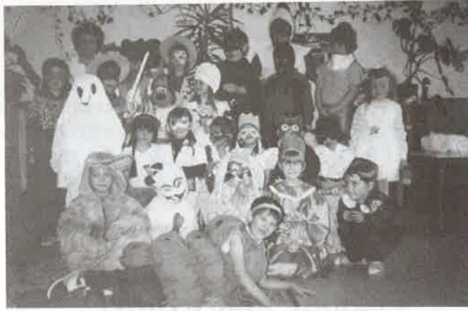
A nagycsoportosok jelmezei is ötletesek voltak