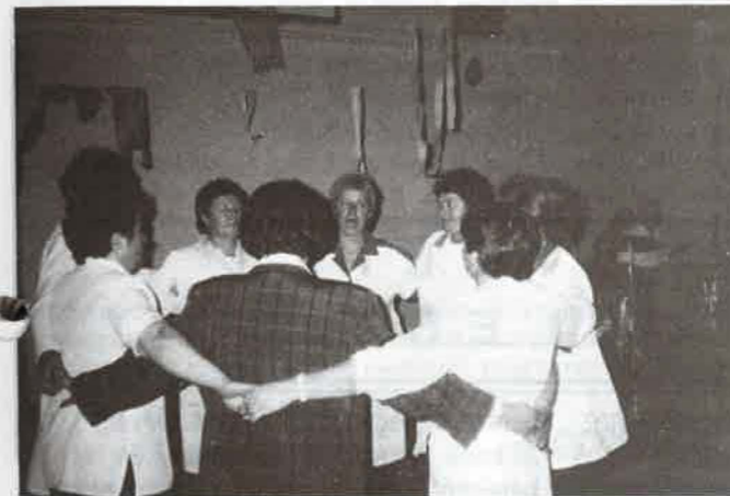
Hölgykoszorúban a konyhások