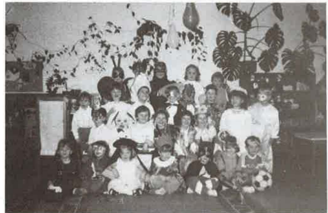
A kiscsoportosok jelmezben