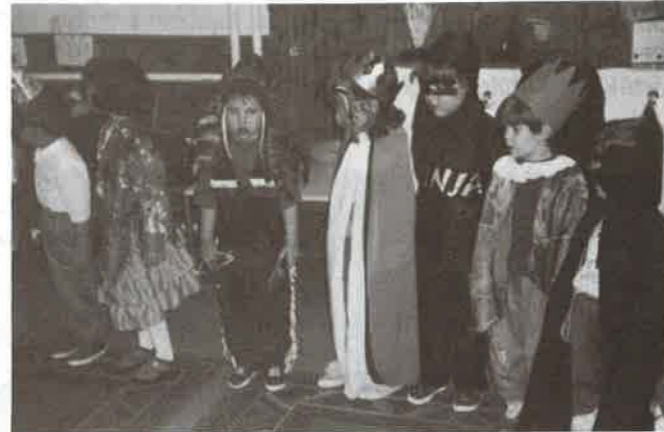
Ötletes jelmezek egy csoportja