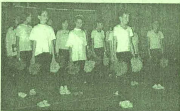
A 4. osztályosok pom-pom előadással kedveskedtek a vendégeknek.