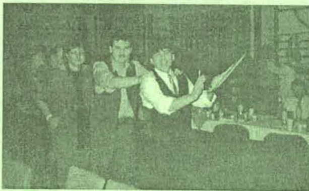
Hajnalban tetőfokára hágott a hangulat: indult a „Rimóci sebesvonat”.