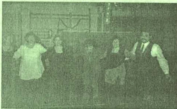
Vendégek tánc közben.