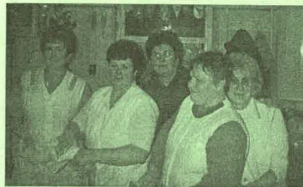
Az óvodai konyha dolgozói főzték a finom vacsorát.