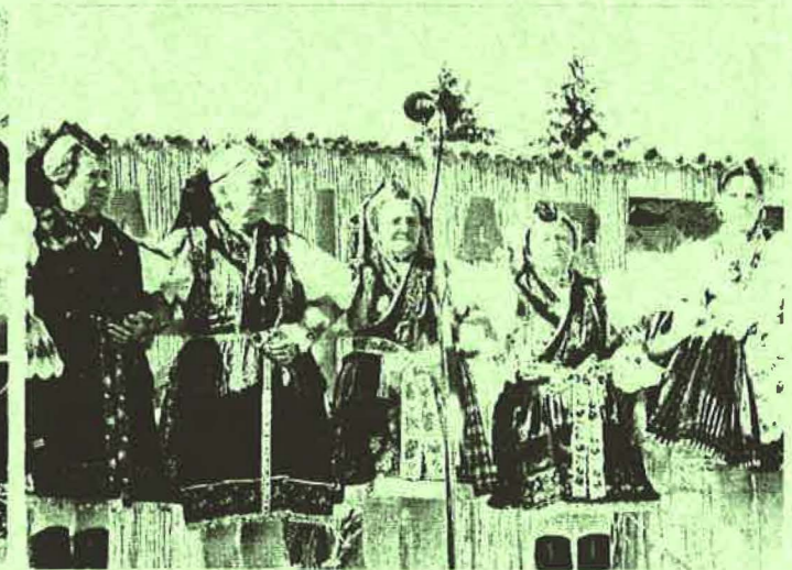
Gyöngyösbokréta Hagyományörző együttes