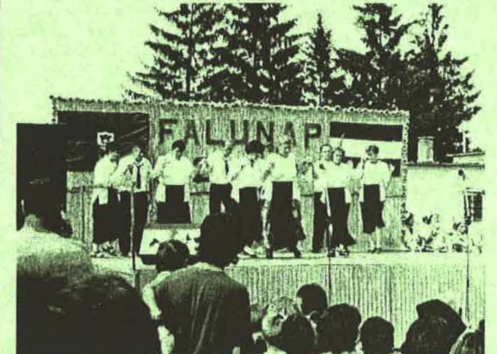
A rimóci általános iskola pedagógusainak görög tánca