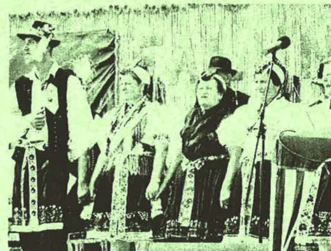
Rimóc Hagyományörző együttes