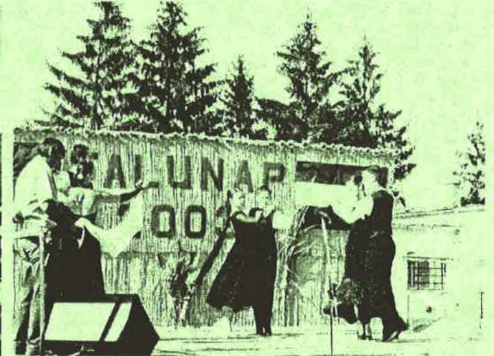
Swng budapesti táncklub salgótarjáni csoport