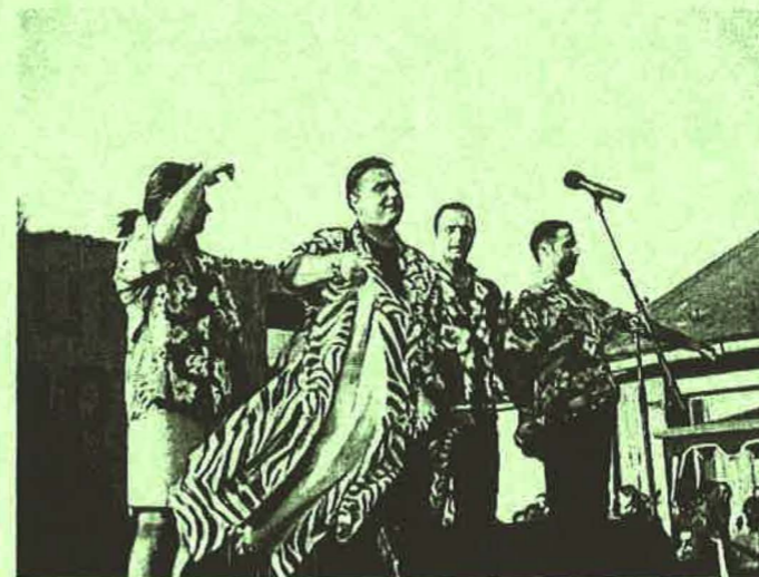
Irigyhónaljmirigy volt a sztárvendég