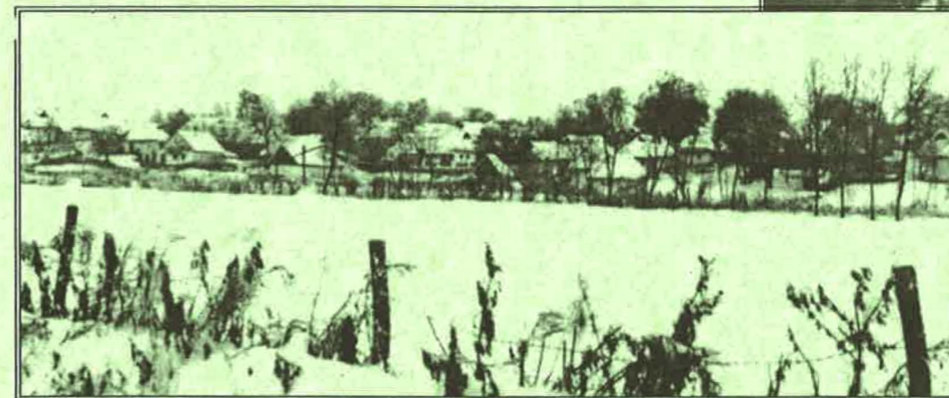
Néprajzi Múzeum, F 9798, Sebestyén Gyula, 1909. (részlet)

Sebestyén Gyula (1864-1946, folklorista, irodalomtörténész) képe a legrégebbi templomábrázolás is többek között. Ez a kép az egyetlen, amely a templomot a kereszthajók nélkül, az 1912-es bővítés előtt ábrázolja. (Sajnos csak oldalról, félig takarásból) Azt is mutatja, hogy a templom hossza már akkor ugyanolyan hosszú volt, mint napjainkban, csak a két kereszthajót illesztették hozzá 1912-ben.