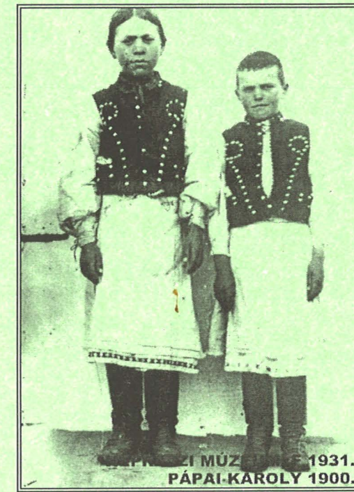
NÉPRAJZI MÚZEUM, F 1931. PÁPAI-KÁROLY 1900.

ISKOLAI BATYUSBÁL ÁPRILIS 24., 19.00 óra