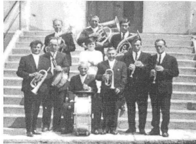
Születésnapja alkalmából gratulálunk és kívánjuk a legjobbakat!!

Igen, újjászerveztem a Rezesbandát. Kottákat írtam, egyházi zenére és felkészítettem őket a szereplésre. Az énekek összeállításánál igyekeztem olyan dallamokat feleleveníteni, amelyek a kottás Hozsanna könyvben nem szerepeltek. Nagyon sok körmenet, egyházi rendezvény színvonalát emelték az általam felkészített zenekarok. Nagyon szívesen foglalkoztam volna a zenekarok felkészítésével, de sajnos betegsémem miatt kántori tevékenységemet 1994 évben abba kellett hagyni.