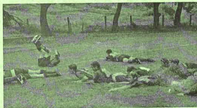
Hason csúszás a vizes pályán