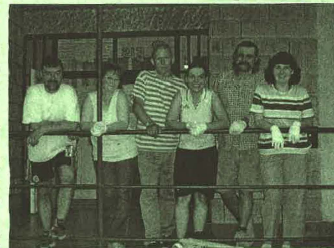
A társaság, miután 2 zsák szemetet szedett össze az utcákon.

Iskolánkban lezajlott a nyolcadikos tanulók középfokú intézményekben történő jelentkezése. 2005. áprilisában mindenki kézhez kapta a felvételtől szóló határozatokat.