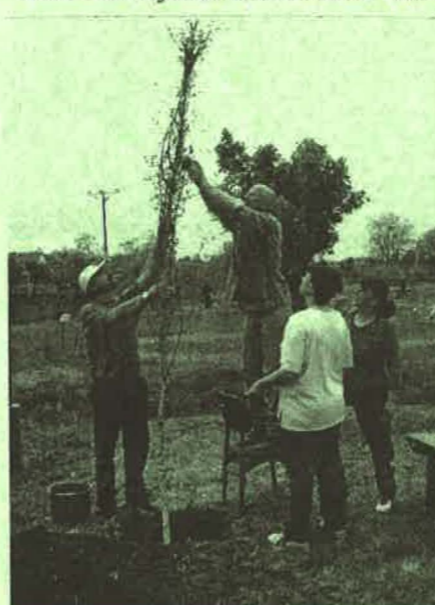
A KOBÁK egy része a faültetés munkálatai közben, míg a többiek a bogrács körül tevékenykedtek.

Az első összejövetelen valóban előkerült a kártya, majd az idők során többször is, de mégis volt valami más, amiért a kezdő tagok szerdánként eljtek. A felszabadult - néha azért komoly - beszélgetések, a nevetések, a közös játékok összekovácsolták a "csapatot". Így jutottunk el oda, hogy megfogalmazódott közöttünk az igény: szeretnénk létrehozni egy közös egyesületet. Hogy miért?