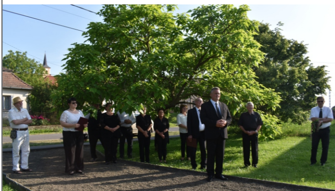
A megemlékezésen résztvevők

Hogy történjen bármi, amíg élünk s meghalunk Mi egy vérből valók vagyunk!”