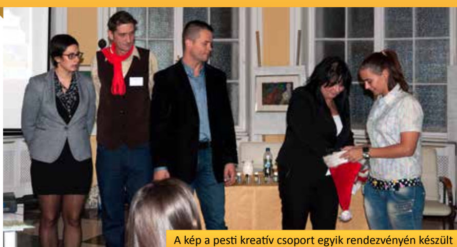
A kép a pesti kreatív csoport egyik rendezvényén készült