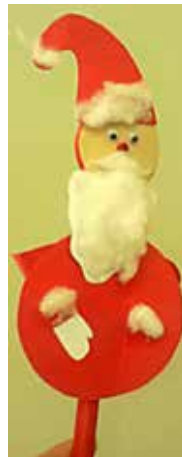
Mikulás pálcá. Nicholaus stick.

Karácsonyi játékok jellemző motívuma a fa. Elsőként vélhetően Luther Márton állította égő gyertyákkal díszítve. Az első pesti karácsonyfa Brunsvik Teréz grófnőhöz kapcsolható 1824-ben. A plafonig érő fa az amerikai kultúrában jelent meg az 1890-es években, ahol a XX. század elején házi készí-