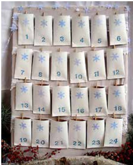
Adventi naptár WC-papír gurigákból. Advent calendar made of empty toilet paper rolls.

Az első kézzel készített adventi naptár 1851-ben, nyomtatott változata (G. Lang) 1908-ban jelent meg kisablakok nélkül, színes képek katonra való feltűzésével (HVG, 2009).