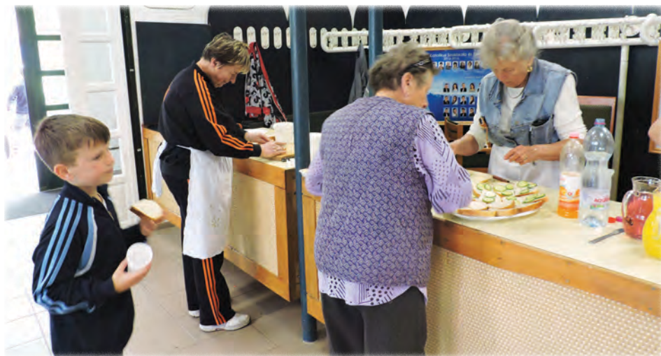
A „hadtápos” különítmény

Azoknak sem kellett unatkozniuk, akik már teljesítették a próbákat, vagy akik a rajtra várokoztak. Kicsik és nagyok tölt- hették el az időt a Fanyúvők játszóház szellemes eszközeit kipróbálva. >>>