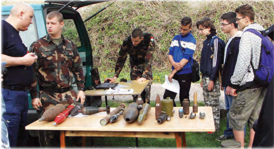
Az MH. Bakony Harckiképző Központ állomásán

Bárki bármit gondol a polgárőrségünkről (ld. pl. facebook), meggyőződésem, hogy a 2016 áprilisa a 15 éves egyesületünk életében a legmozgalmasabb hónap volt.