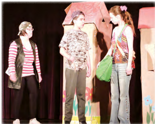
Szép lelkek társulata