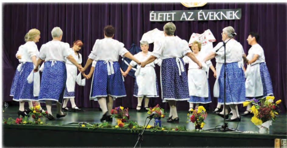
Dunántúli leánytánc – Jó Szerencsét Nyugdíjas Klub Tánccsoportja