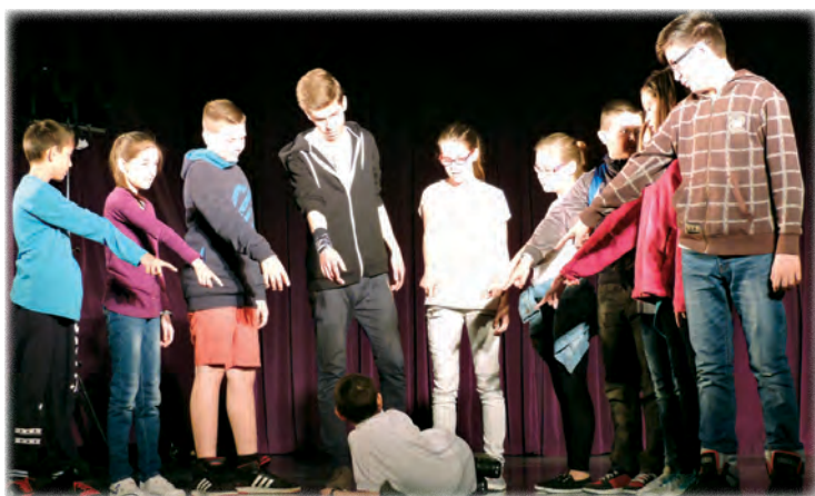
Az Alkat csapata

Idén hat csoport vett részt a megmérettetésen. Itt voltak a berhidai Persze és után-