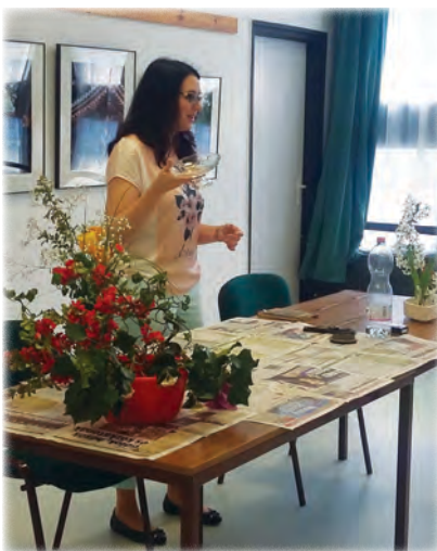
...így pedig az ikebana