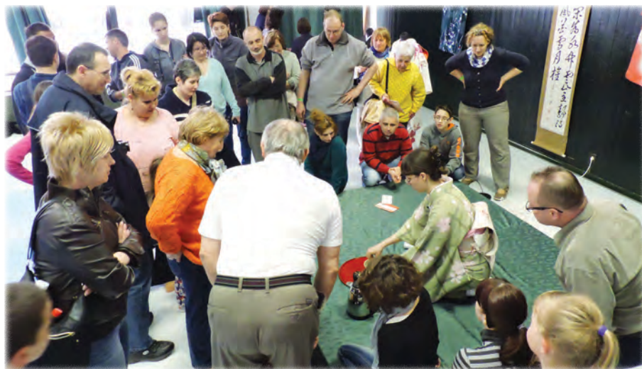
Japán tea kóstolása