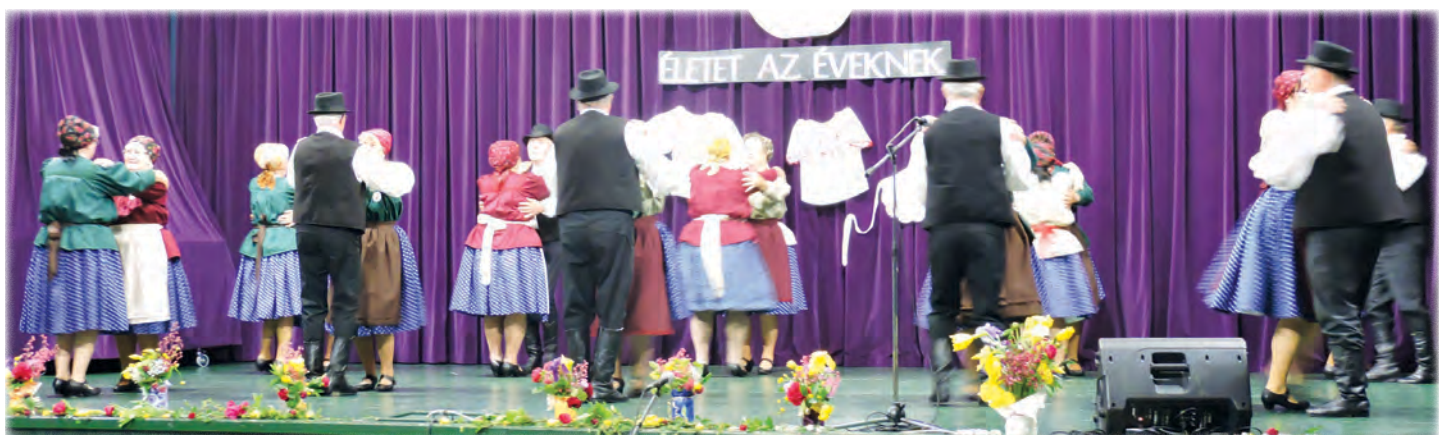
Mezőföldi táncok – Muskátli Táncsoport