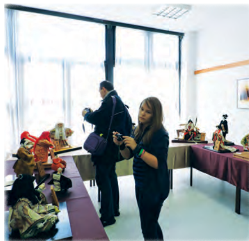
A Japán Alapítvány babagyűjteményének egy részét is megtekinthették az érdeklődők