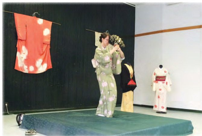
Japán legyezős tánc