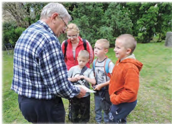
A kertbarátkörösök állomásán