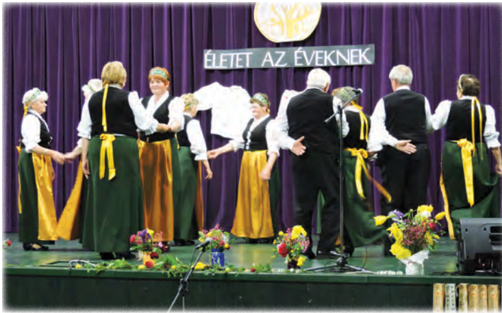
Palotás – Szentgáli Nyugdíjas Klub Tiszafa Táncköre