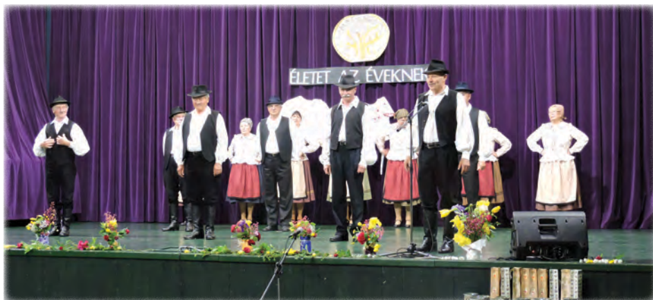
Szatmári lassú és friss csárdás – Ringató Balaton Néptánccsoport

A Nyugdíjasok Életet az éveknek Veszprém Megyei Egyesülete, a Péti Nyugdíjas Klub, valamint a Pétfürdői Községi Ház és Könyvtár közös szervezésében került sor településünkön május 13-án a Veszprém megyei néptáncfalókörre.