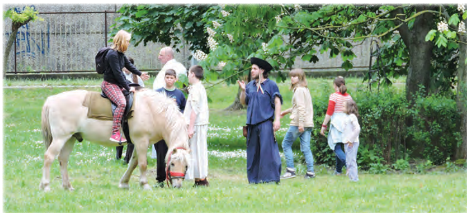
Lovagolni jó! Lovagolni jó!