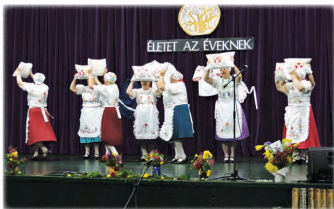
Kalocsai párnás tánc – Gizella tánccsoport