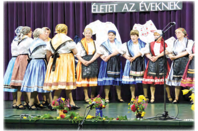
Sárközi karikázó – Őszidő Nyugdíjas Klub Táncsoportja