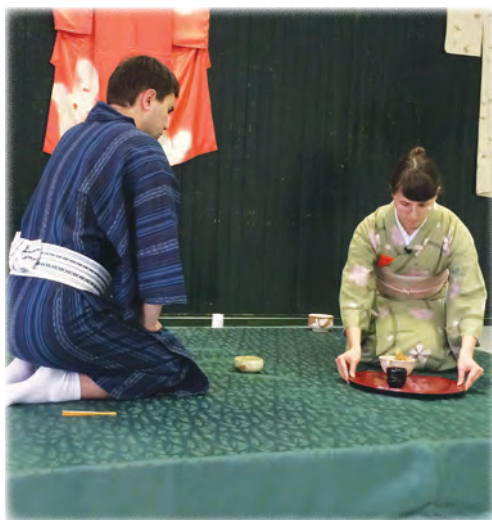
A teaceremóniának szigorú szabályai vannak