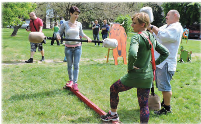
A Fanyúvők játszóházban