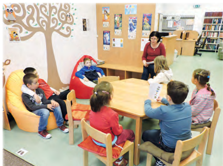
Öko-totó a könyvtárban