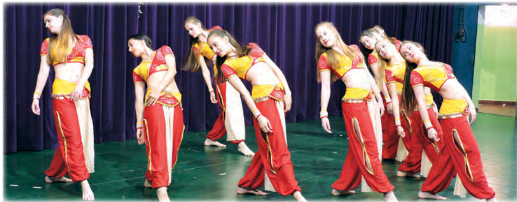
Dance Action junior csapata