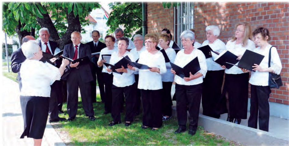
Szent László Kórus

– Várpalota jegyzője erre a vasárnapra írta ki a helyi népszavazást. A népszavazás rendben lezajlott, érvényes volt, mert a szavazó polgárok több mint a fele felkereste a szavazóurnákat, és eredményes is