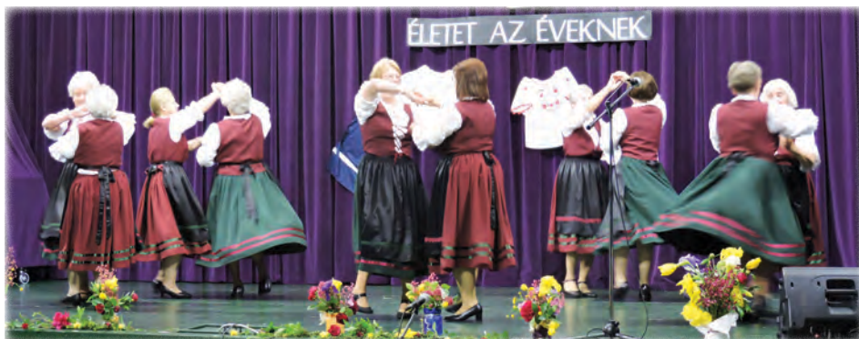
Sváb tánc – Rozmaring Néptánccsoport