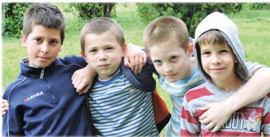
Egy elszánt csapat