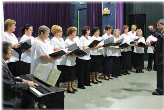
Napfény Női Kar