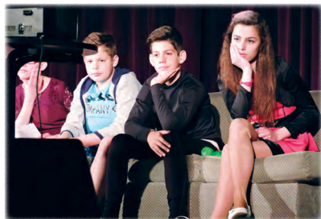
Ma, mint Ti

Nemcsak saját színjátszóinkat istápolgatta, támogatta a település az elmúlt