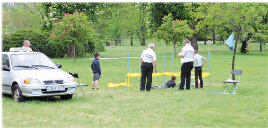
A polgárőrök kúszófolyósója