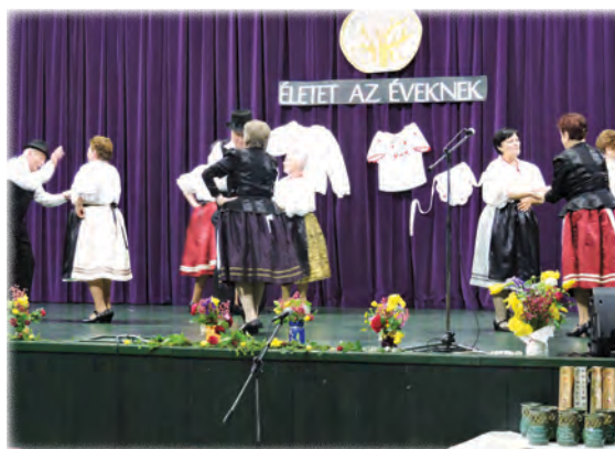
Csallóközi tánc – berhidai néptánccsoport