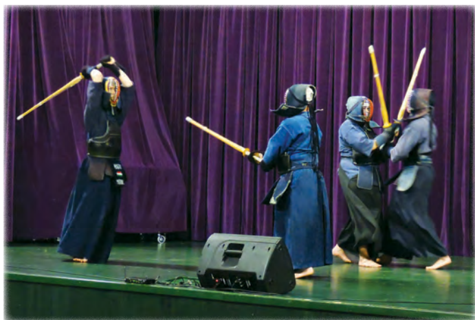
Bakony Kendo és Iaido Klub