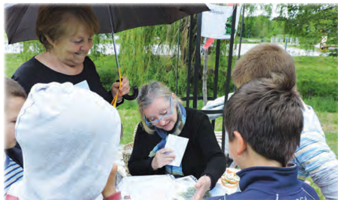
A Település Védő és Szépítő Egyesület állomásán

>>> Részt vehettek az Európálánta Egyesület környezettudatos, a szelektív hulladékgyűjtés fontosságát játékosan oktató társasjátékában. Népi hangszerekkel is ismerkedhettek. Egy másik helyen a Bakony lombsátrai alatt élő állatok szokásai, viselkedése, testalkata, külső jegyei kerültek bemutatásra. Az előcsarnokban a környező erdőben honos madarakról, növényekről kaphattak kérdéseket a gyerekek, a jó válasz egy-egy cukorkát ért.