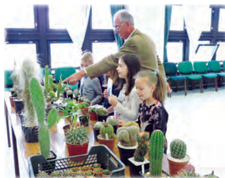
Azok a csodálatos kaktuszok