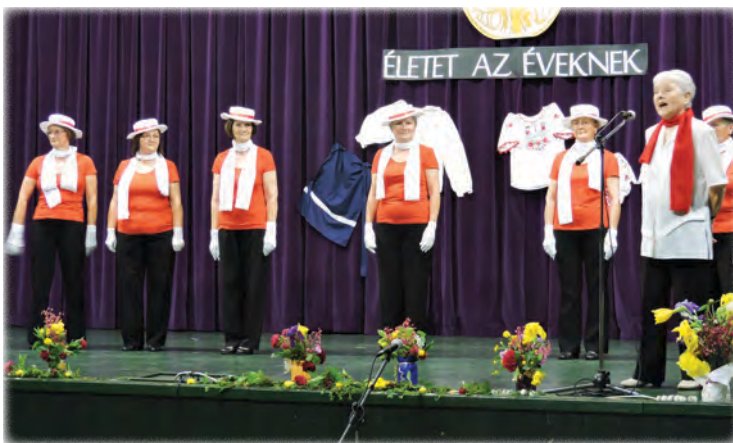
Charleston – Ajka-Padragkúti Nyugdíjas Klub kamaracsoportja