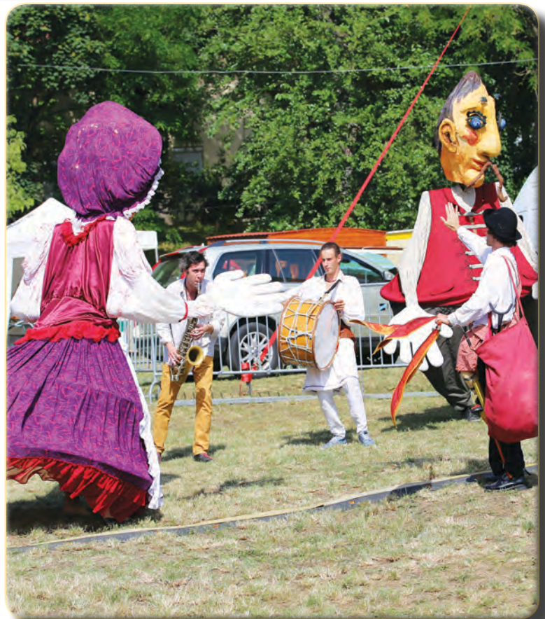
A Bab társulat