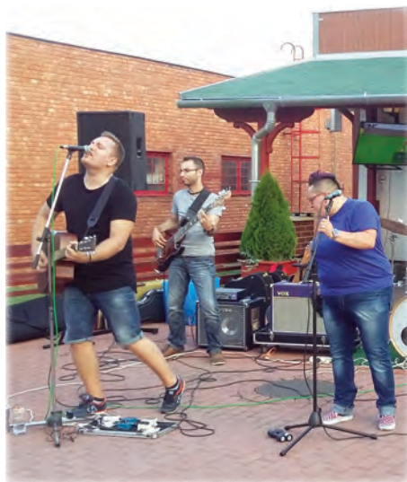
A Dirty Slippers zenekar

Július 23-án a Horizont mögötti téren a már megszokott módon Örömszenére várta az érdeklődőket a Pétfürdői Községi Ház és Könyvtár. Az áramot ismét a Végh Borozó szolgáltatta, amelyért köszönetüket fejezik ki a szervezők.