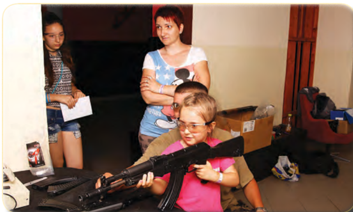
Airsoft az alagsorban