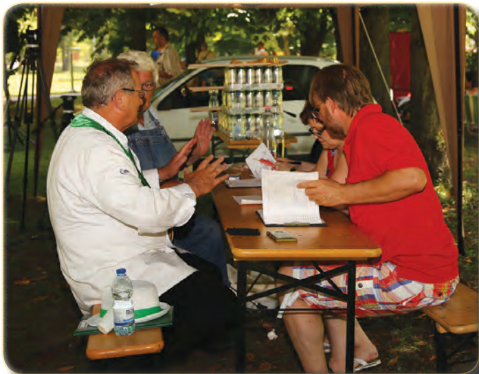
A zsűrinek nem volt könnyű dolga