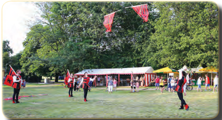
A Bandiera Zászlóforgatók