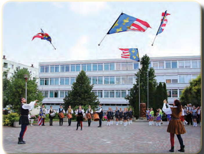
A Pavane Zászlóforgatók és Dobosok