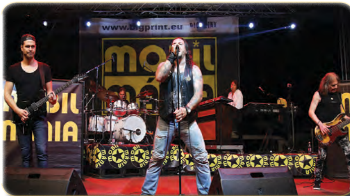
Koncertezik a Mobilmánia