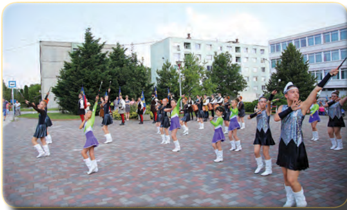
Mazsorettek a Millenniumi téren