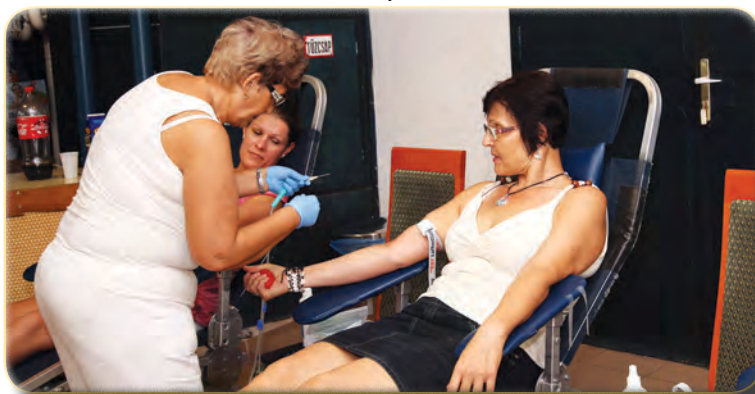
A Magyar Vöröskereszt szervezésében véradásra is sor került