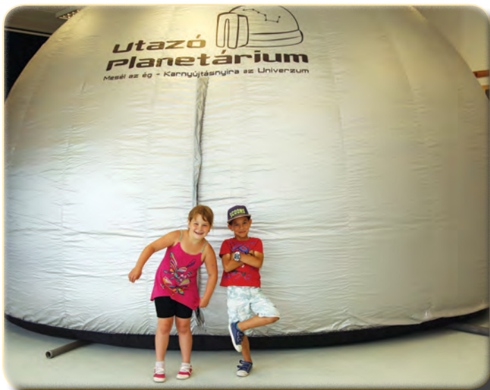
Az Utazó Planetárium bejáratánál