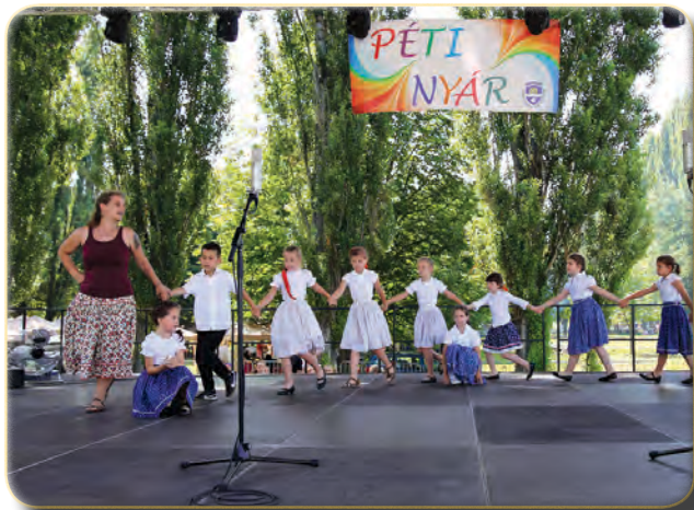
A közösségi ház gyermeknéptánc-csoportja