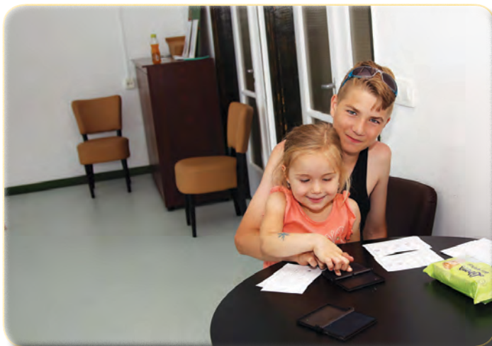
Az Add a kezed kiállításon