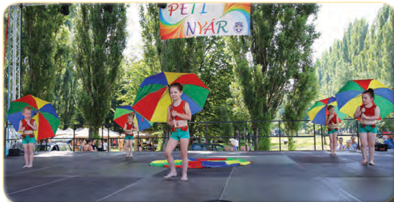
A Crystal Fitness SE