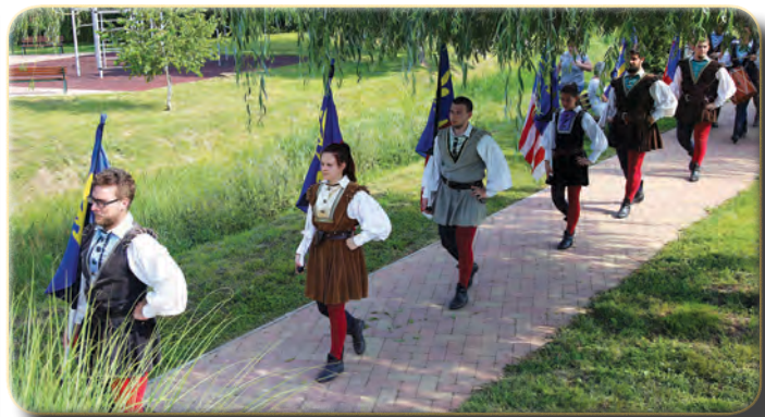
Vonulás az Ifjúsági tó partján