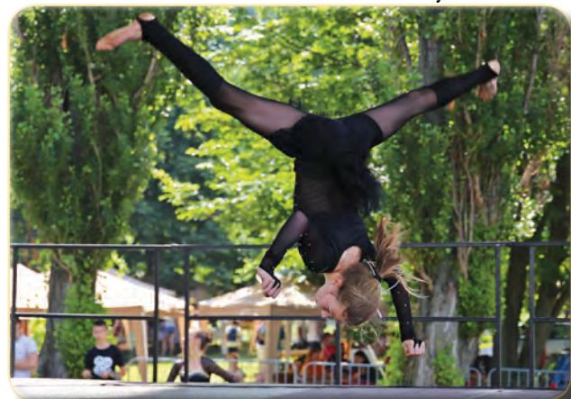
Balaton Fitness SE