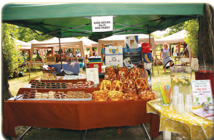
Az ízek ösvényén