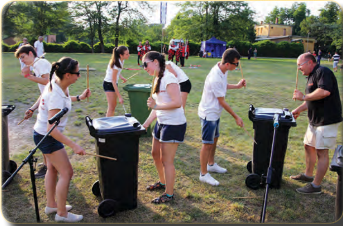
A Marcato Ütőegyüttes