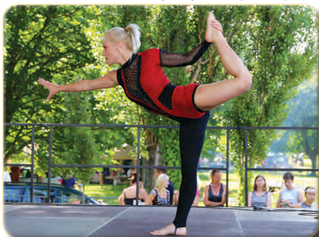
A Crystal Fitness SE