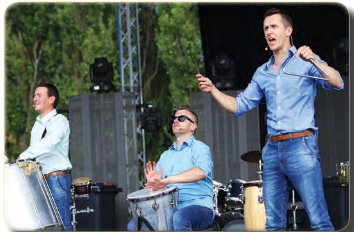
A Talamba Ütőegyüttes