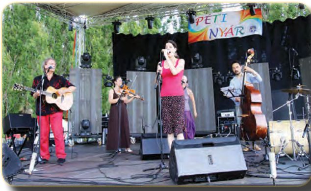
A Makám együttes