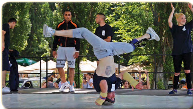
Radical Force and Black Steps Crew