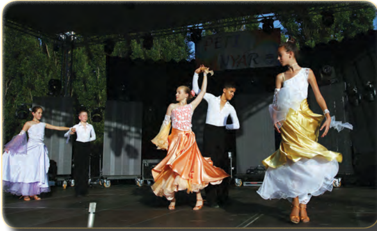
A Winners Verseny tánc Egyesület