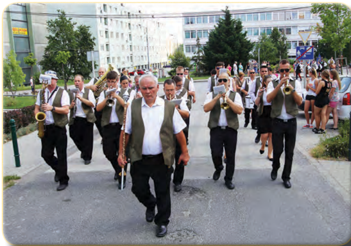
A Soroksári Fúvószenekar