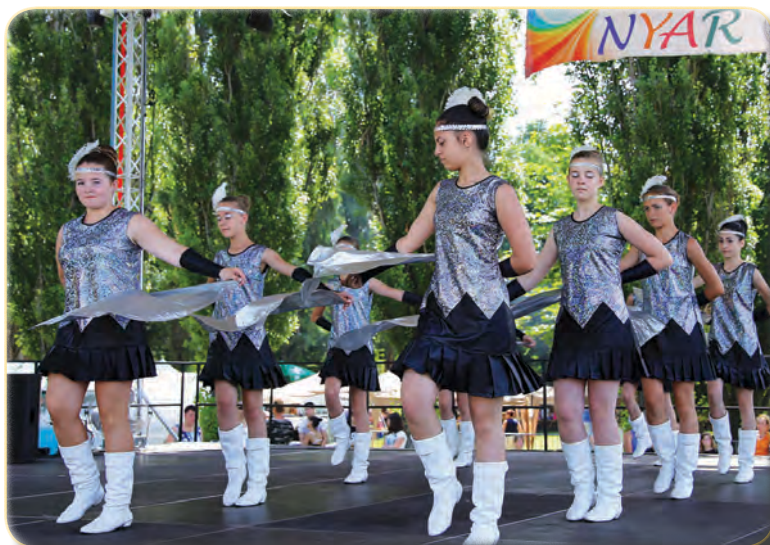
Az Eszterlánc Mazsorett Együttes