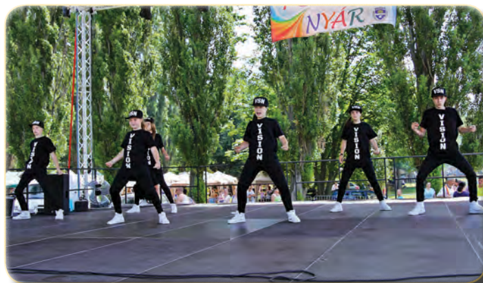
Vision Hip-Hop Tánciskola