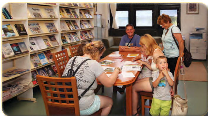
A könyvtárban totót is ki lehetett tölteni