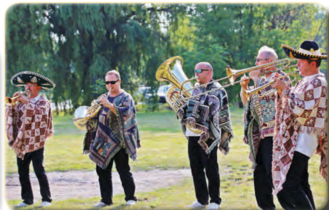
A Brassdance Fúvóegyüttes