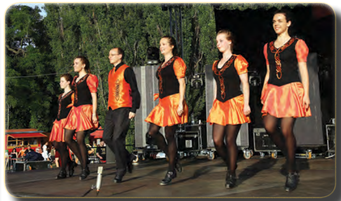
Az Erin Ír Szepténc Társulat