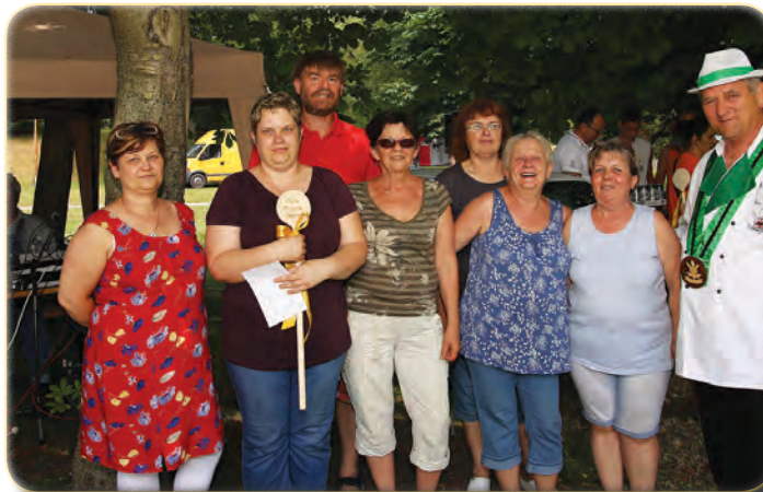
A 2016-os Péti Nyár főzőversenyének győztese a Csipet-csapat