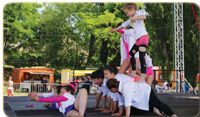
Aerofit Aerobik csoport