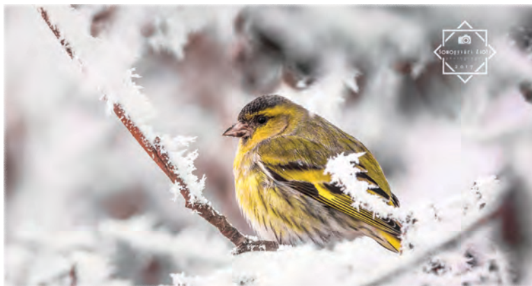
Somogyvári Zsolt: Csíz