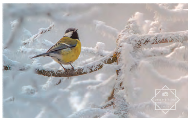
Somogyvári Zsolt: Széncinege