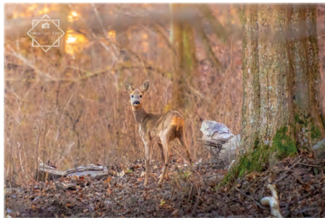
Somogyvári Zsolt: Őzsuta