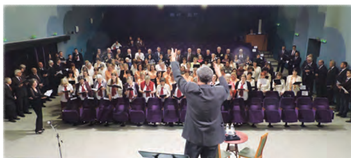
Az összkari mű próbája