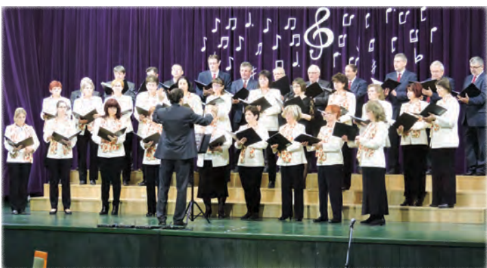
Várpalotai Bányász Kórus