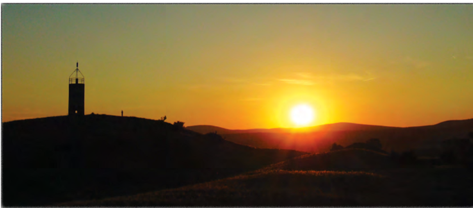
Buzás Dániel: Lemenőben