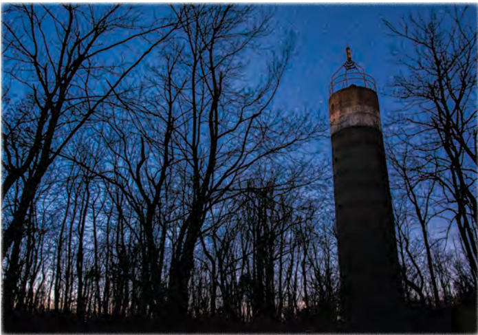
Buzás Dániel: Az első csillagok