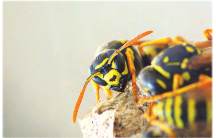
Buzás Dániel: Szentől szemben