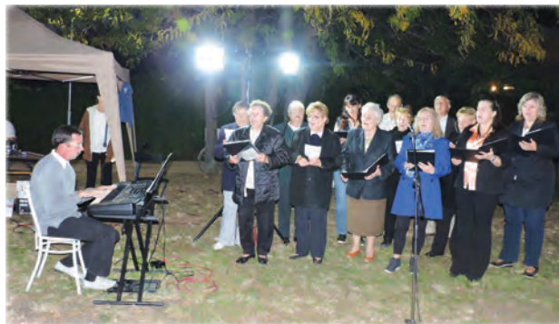
A Szent László Kórus énekel a függetlenség napi ünnepségen