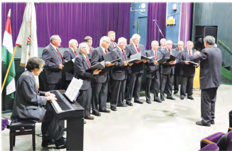
A Péti Férfikar

Az új vezetőség a régi vezetőségi tagok segítségével betanulási időszakban van.