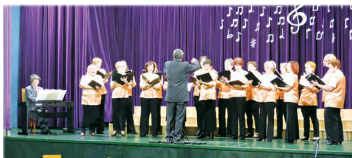
Napfény Női Kar