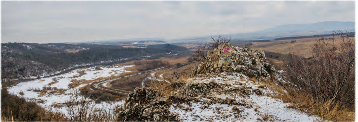
Buzás Dániel: A szikla tetején