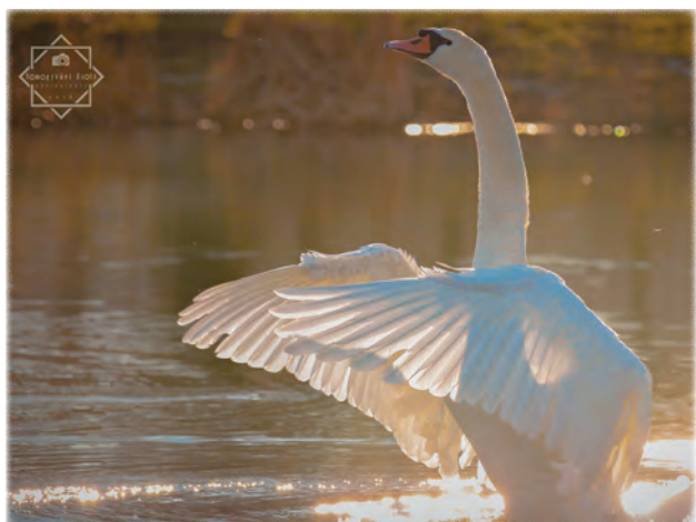
Somogyvári Zsolt: Tavi balett