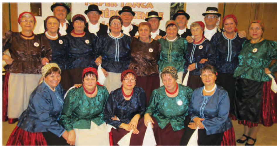
A Muskátli Néptáncsoport Keszthelyen

December elsején tartottuk a zenés évszáró klubnapunkat vacsorával egybe-