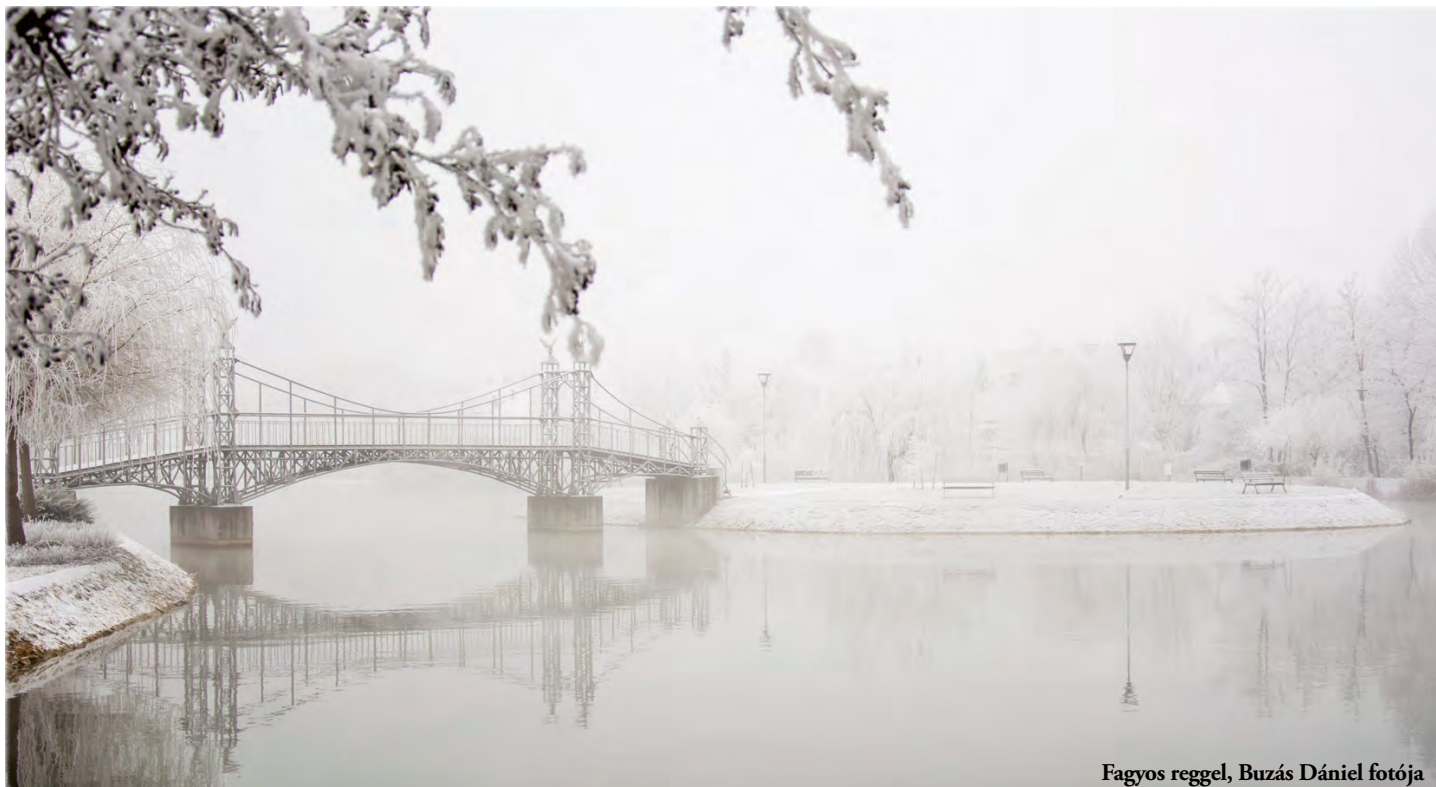
Fagyos reggel