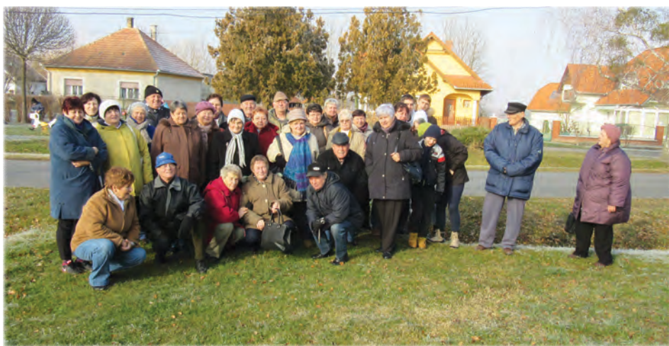
A Péti Nyugdíjas Klub tagjai Vörsön

Megtartottuk az immár hagyományos szilveszteri óév búcsúztatót is a Pétfürdői Közösségi Ház és Könyvtár segítségével, ami sikeres volt. Minden támogatóknak köszönjük a megrendezéséhez nyújtott segítségét.