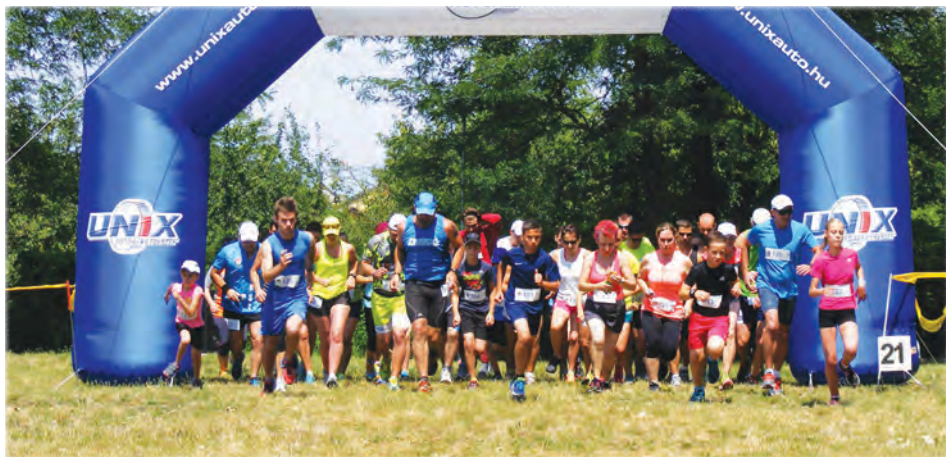
A Pétfürdő-Öskü félmaraton rajtja

Az első évünkben már elindítottuk a Nyusziváráó futóversenyt gyerekeknek. Sokáig gondolkoztunk rajta, hogy milyen versenyt és mikor rendezzünk. Abban megegyeztünk, hogy elsőnek gyerekeknek akarunk futóversenyt szervezni. A Mikulás már foglalt volt, maradt a húsvét. Viszont húsvétkor ki jönne le versenyezni? Ezért döntöttünk úgy, hogy húsvét előtt egy héttel rendezzük, és elneveztük Nyusziváráó futóversenynek. Itt csak 8. osztályig indulhatnak versenyzők. Már az elejétől kezdve minden induló ajándékot kap, és az első három helyezett érem-díjazásba részesül. Az idei verseny lesz a 9. Nyusziváráó futóverseny, és most április 9-én kerül rá sor.