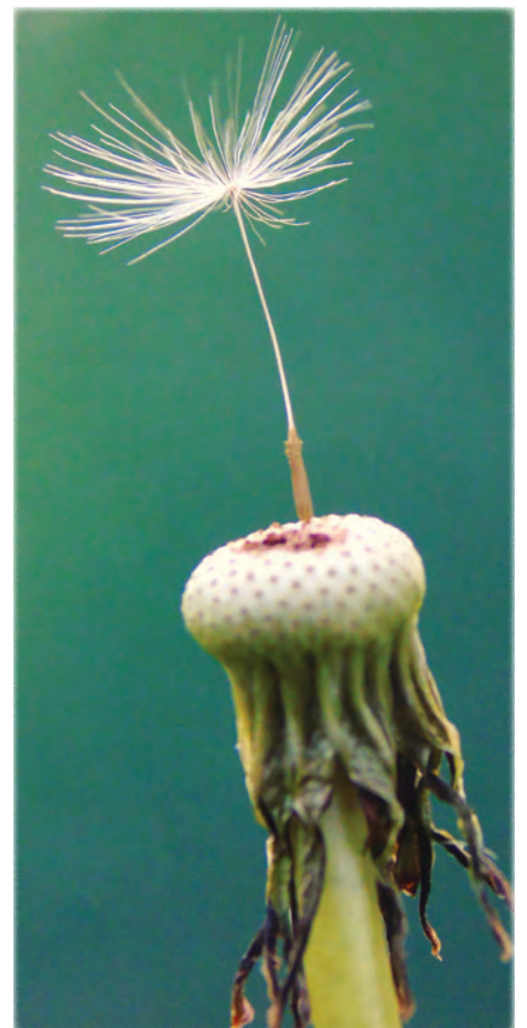
Buzás Dániel: Az utolsó