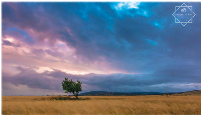
Somogyvári Zsolt: Elemi erő