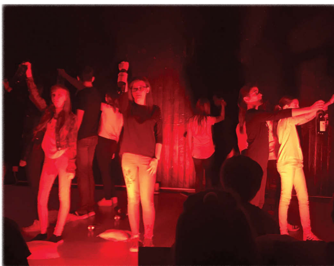
A peremartoni Persze csoport