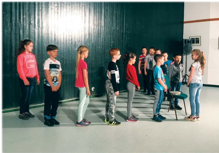
A berhidai Pereszke csoport

Április 27-én, szombaton került megrendezésre a 28. Weöres Sándor Országos Gyermekszínházi Találkozó Veszprém