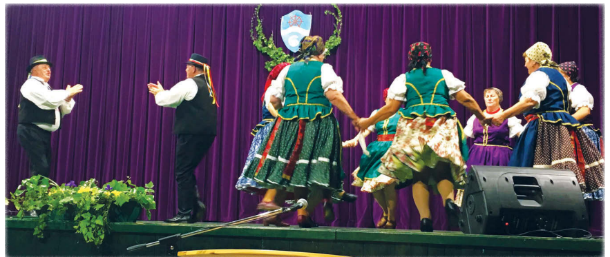
A színháztermi műsort a Muskátlí Táncegyüttes zárta Rábaközi táncával