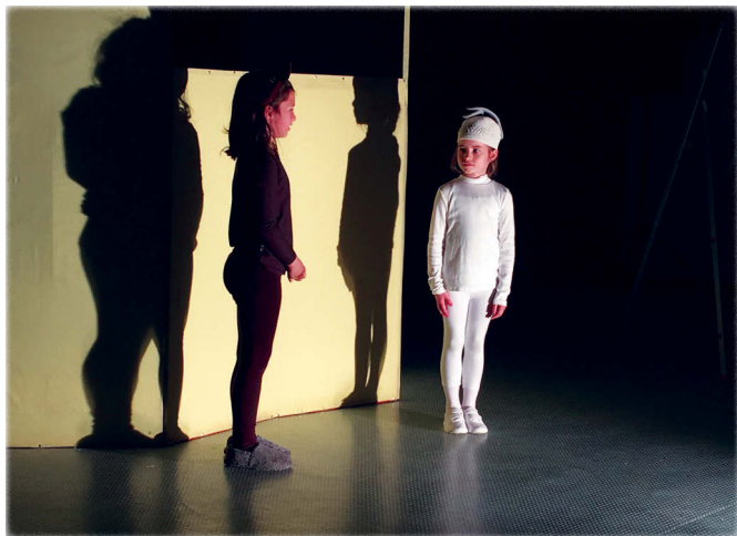
A Négyszögletű kerekdő csoport Balatonfüredről