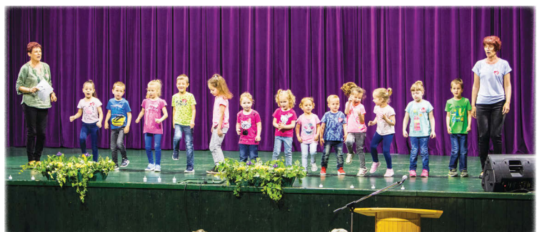
a Katicabogár csoport lépett színpadra