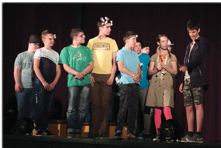
A Széplelkek Társulata Veszprémből