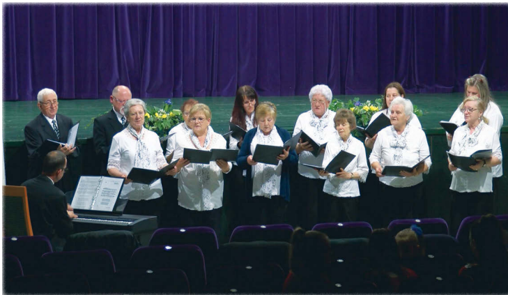
A Szent László Kórus