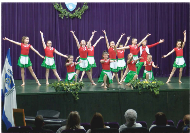
A Dance Action SE magyar tánca