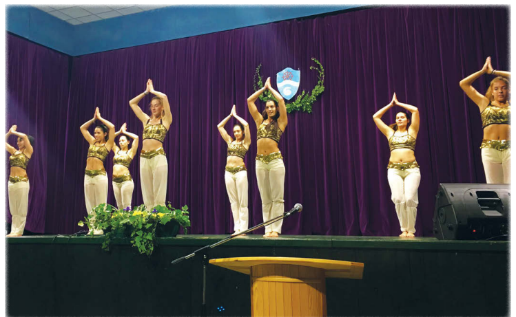
A seinorok Nagin című koreográfiája