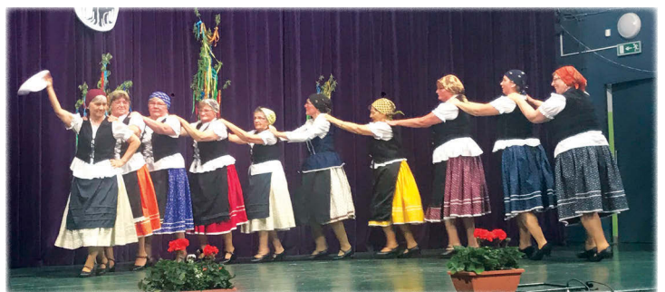
Tiszafa Tánc csoport, Szentgál