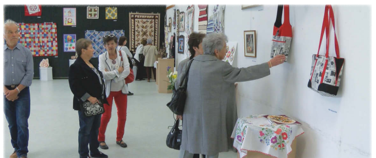
A Közösségi Ház emeleti nagytermében tekinthették meg az érdeklődők az Ügyes kezű pétéiek című kézimunkakiállítást