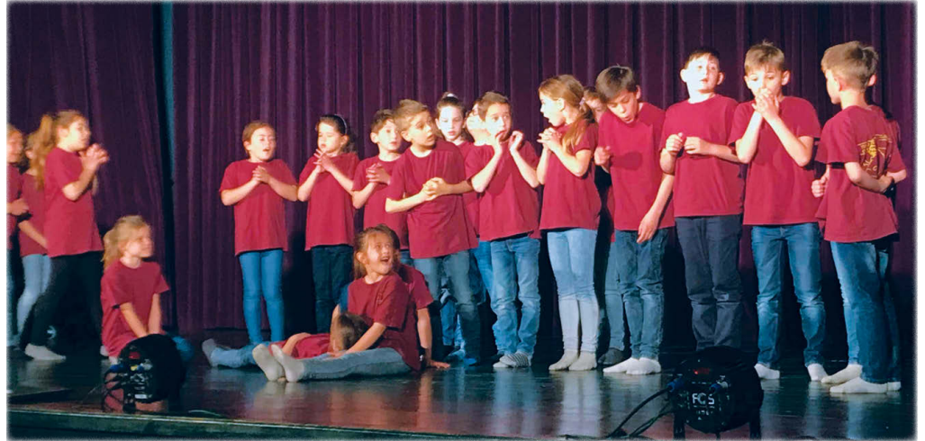
A siófoki Turbó Csiga csoport