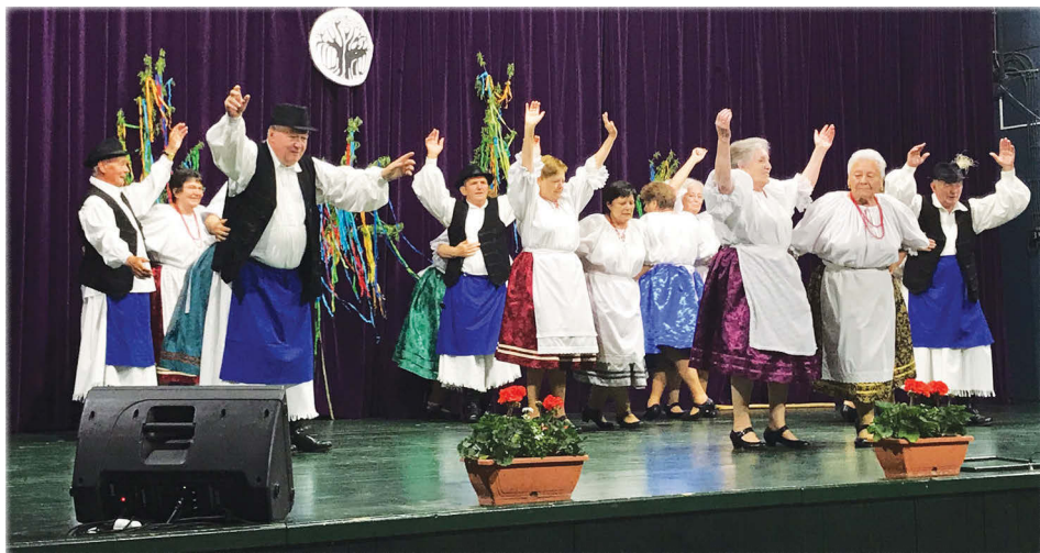
A Berhida Nyugdíjas Klub táncsoportja

» » A bemutatott táncok a következők voltak: Üveges-korsós tánc, Sárközi tánc, Mezőföldi üveges és csárdás, Szatmári tánc, Karikázó és csárdás, Sváb tánc, Szatmári tánc.