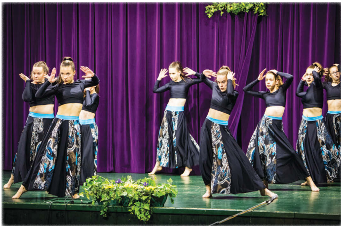
A Dance Action SE junior csoportja