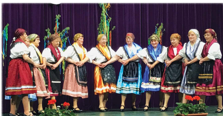
Az Őszidő Nyugdíjas Klub Margaréta Táncsoportja, Veszprém