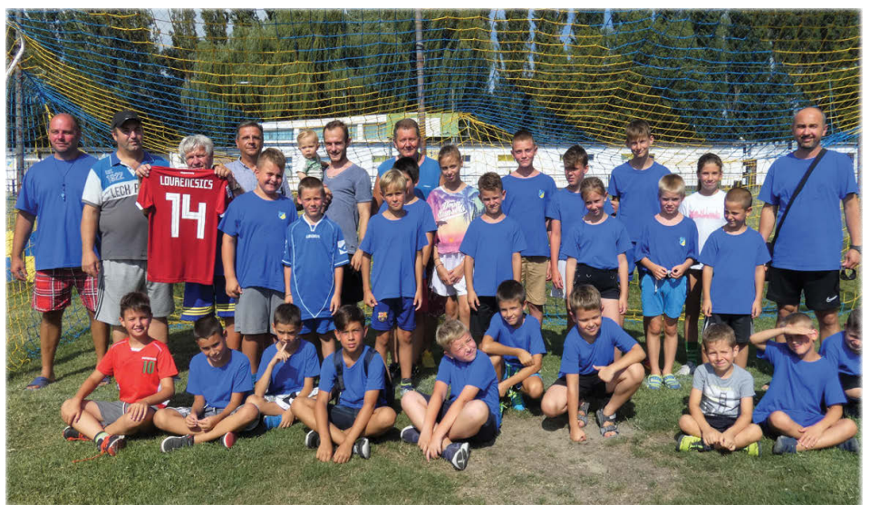
Közös fotó Lovrencsics Gergővel