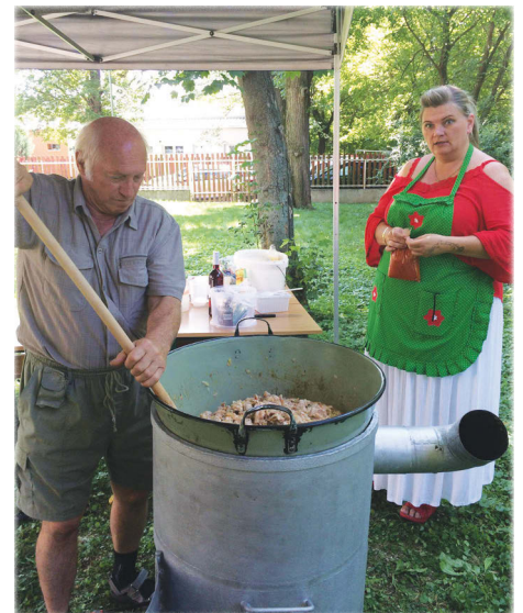
Készül a finom pincepörkölt

Ez a szomszédolás-kísélet azt hiszem, minden résztvevő és hallgató számára megmutatta, hogy a zene, a dal, a népdal képes megteremteni az emberi összetartozás érzését, még ha csak pillanatokra is. De