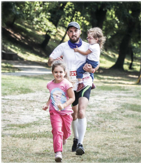
A cél felé

» » » A résztvevőknek a Szabadtéri Büfétől elindulva hol füves, hol aszfaltos vagy éppen murvával felszórt, emelke-