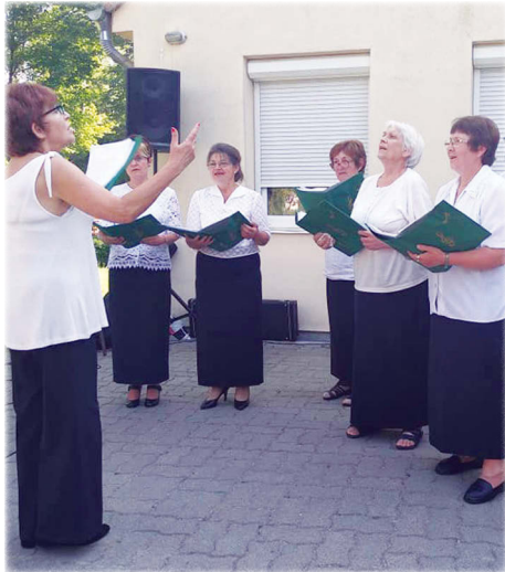
A Balatonfőkajári Dalkör

A 2019-es esztendőben a Péti Nyár programorozat keretében a Szent László Kórus életében egy újabb korszak kezdődött. Megrendezte az első László-napi szomszédolás elnevezésű dalos találkozóját.