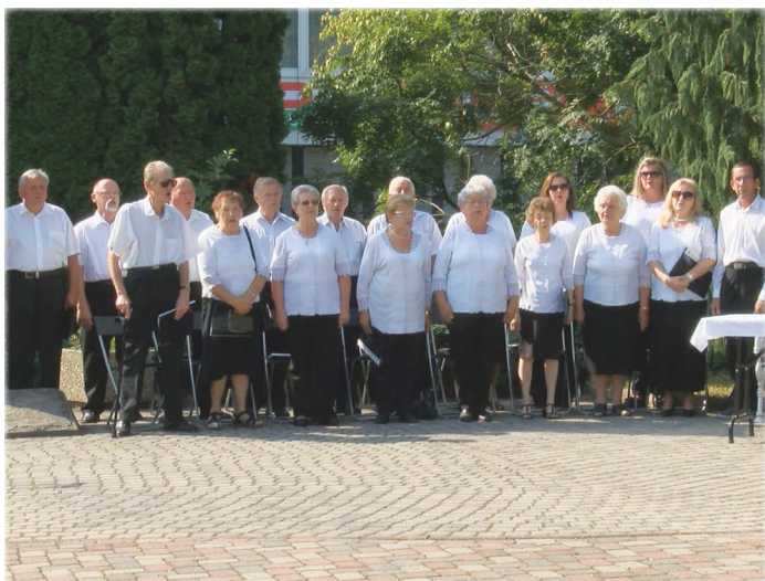
Szent László Kórus

rendszerbe szötte a magyar kultúrát, az ország vezetésének módját és területi kapcsolódásainak kialakítását. Beleszötte a katolikus egyház szakrális tanításait, annak szellemi iránymutatását.