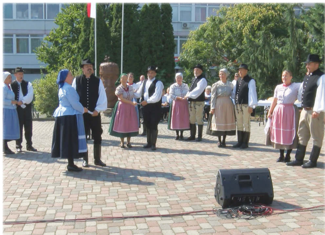
Litéri Szárazág Néptáncgyűttes