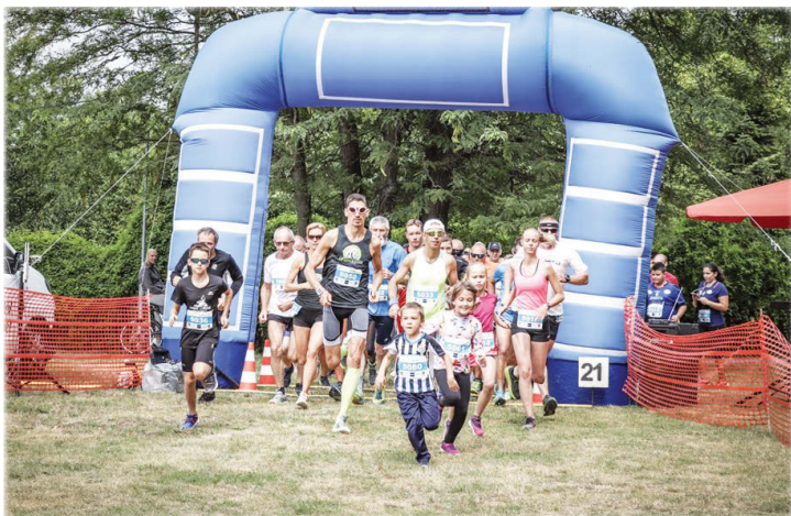
A rajt pillanatai