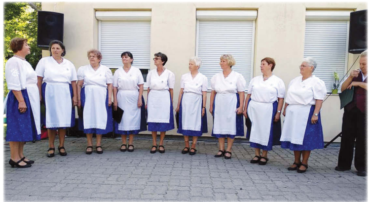
A nemesvámosi Borostyán Népdalkör

A találkozó szerény vendéglátással fejeződött be, amelynek előkészületei már a kora reggeli órákban kez-