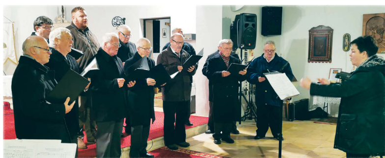
A koncert utolsó fellépője a Péti Férfikar volt