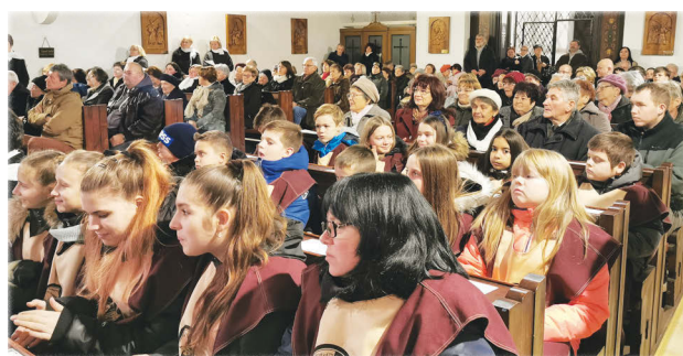
A templom idén is megtelt