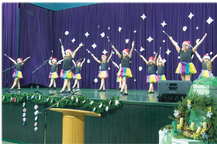
Az ovisok után az Eszterlanc Mazsorett Együttes Liliom,