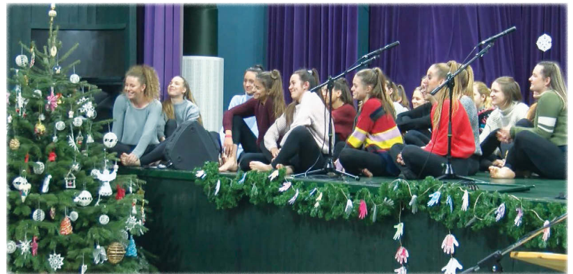
lepte meg a közönséget