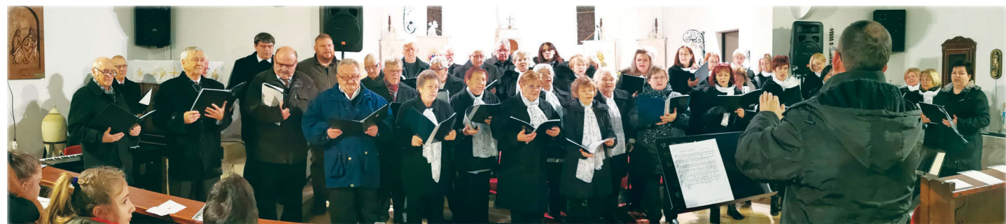
A három felnőtt kórus búcsúzóul a Szöllösi Zoltán által komponált Adventi kánont adta elő