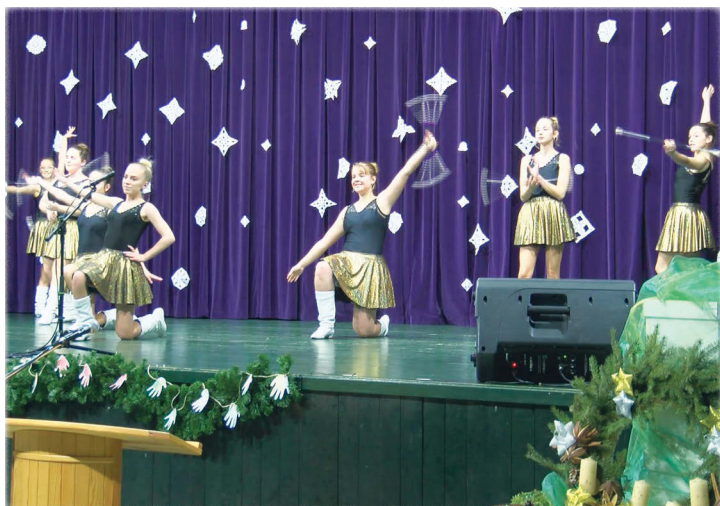
és Viola csoportja mutatta be produkcióját