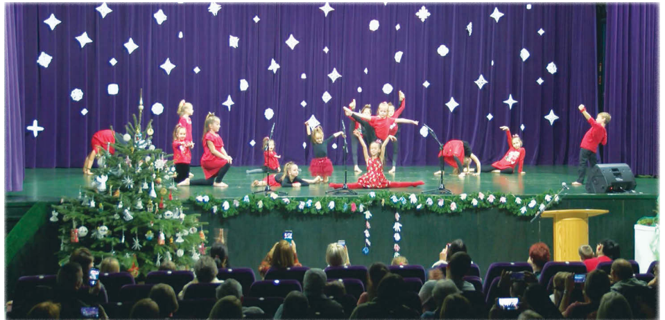
A Dance Action SE három korcsoportja