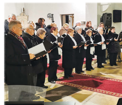
A Szent László Kórus idén különleges műsort adott