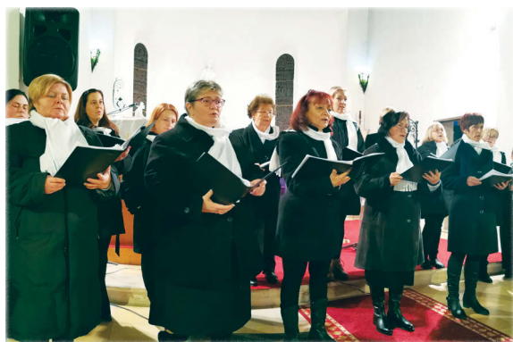
a Napfény Női Kar énekelt