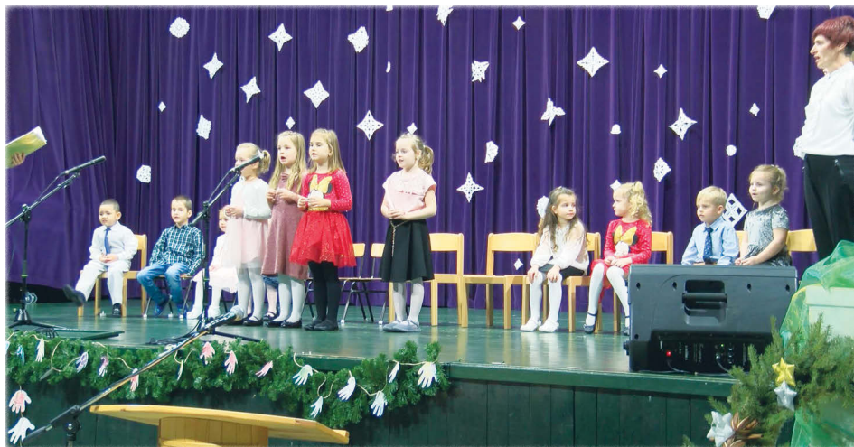
a Katicabogár csoport lépett színpadra