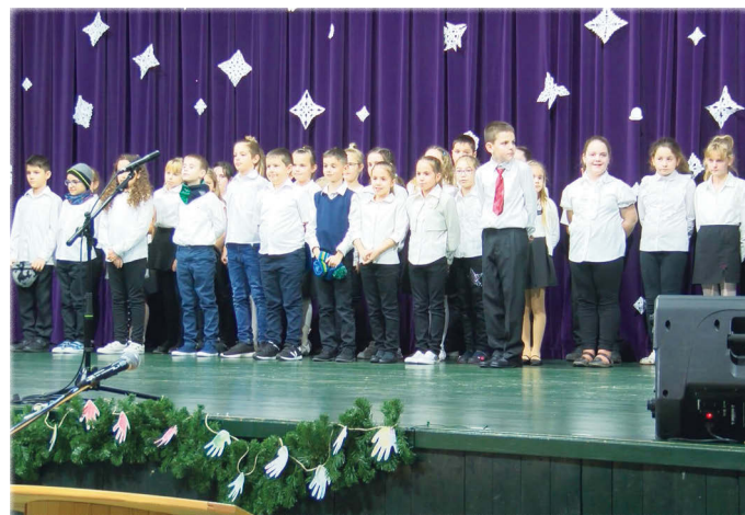
A Horváth István Általános Iskola 3. osztályosai zenés-verses összeállítással készültek az ünnepségre