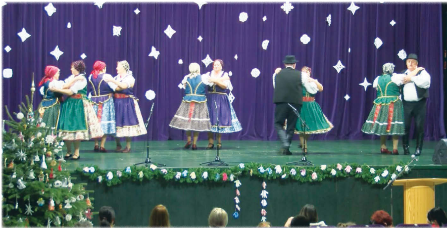
A Muskátli Táncegyüttes Rábaközi tánca után