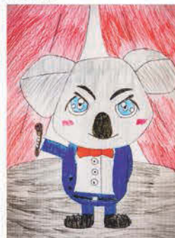
Szalai Virág 9 éves