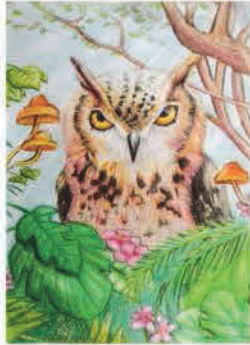
Bálint Anett Dorotea 7. b osztályos tanuló