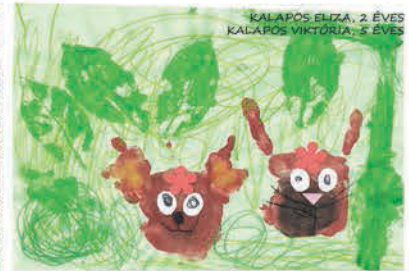
Kalapos Eliza és Kalapos Viktória 2 éves és 5 éves