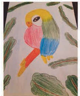
Veres Kitti 5. a osztályos tanuló