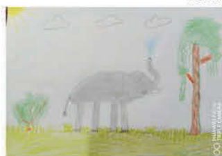
Gergő-Varga Áron 8 éves