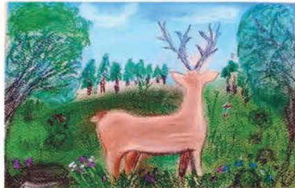
Zima Kristóf 5. a osztályos tanuló