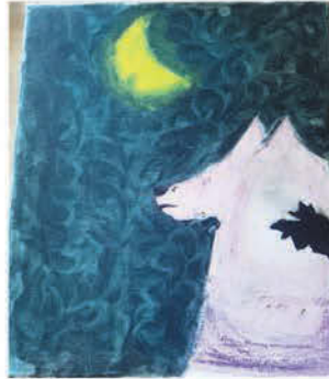
Galajda Dorka 9 éves