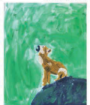
Galajda Dorka 9 éves