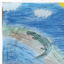
Kujber Milán 10 éves