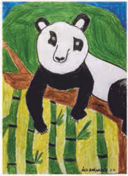
Ács Barnabás 5. b osztályos tanuló