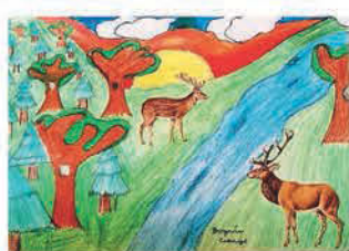
Bognár Csenge Tírza 5. a osztályos tanuló