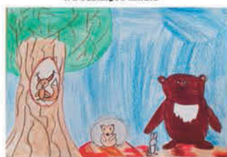
Csiga Liliána 5. a osztályos tanuló