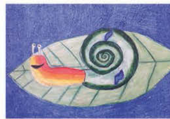
Réger Tímea 6. a osztályos tanuló