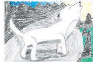
Serfőző Boglárka 9 éves