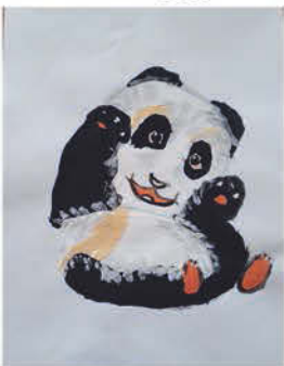
Szakály Hanka 4. a osztályos tanuló