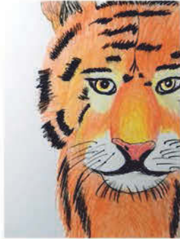
Fazekas Levente 7. b osztályos tanuló