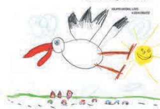
Kalapos Viktória 5 éves