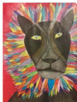
Réger Tímea 6. a osztályos tanuló