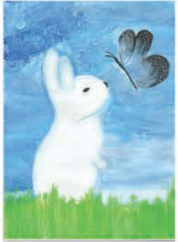
Németh Zsófia 9 éves