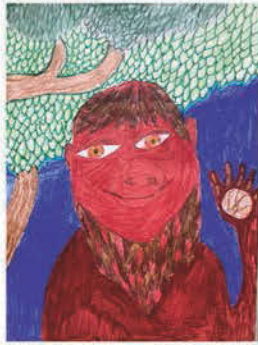
Réger Tímea 6. a osztályos tanuló