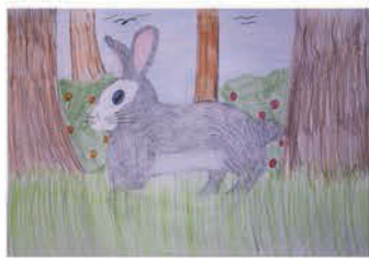
Tászlér Korina 12 éves