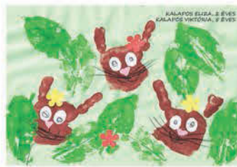
Kalapos Eliza és Kalapos Viktória 2 éves és 5 éves