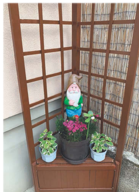
Németh Zsóka készítette