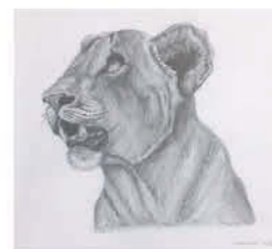
Vinczai Adél 8. b osztályos tanuló