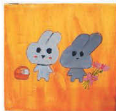
Szakály Hanka 4. a osztályos tanuló