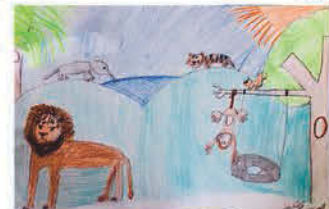
Sülle Szofi 4. b osztályos tanuló