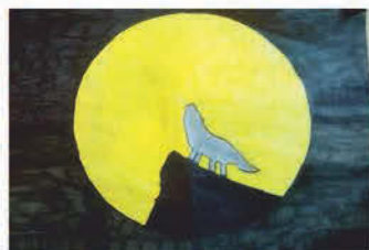
Viktor Zsófia Sára 7. b osztályos tanuló