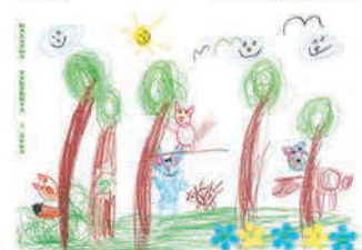
Kalapos Viktória 5 éves