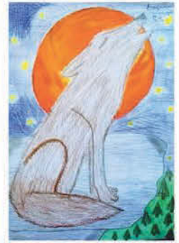
Bognár Csenge Tirza 5. a osztályos tanuló