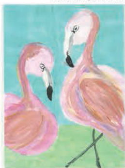
Németh Zsófia 9 éves