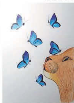
Fazekas Levente 7. b osztályos tanuló