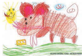
Kalapos Viktória 5 éves