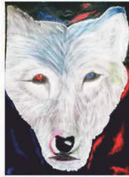
Mészáros Mira 6. b osztályos tanuló