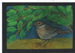
Kollarics Zorka 8 éves