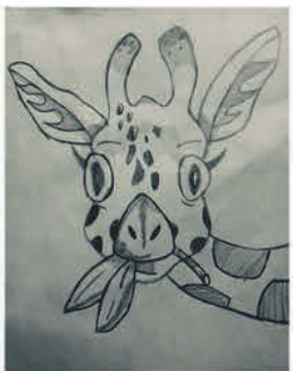
Szakály Zorka 7. a osztályos tanuló