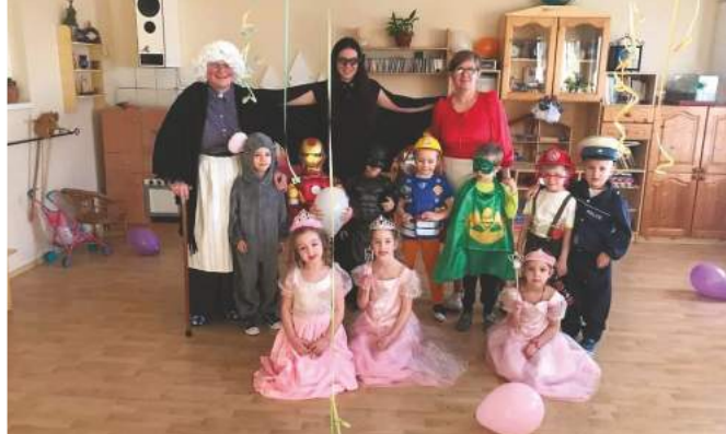
Kékcinke csoport jelmezesei