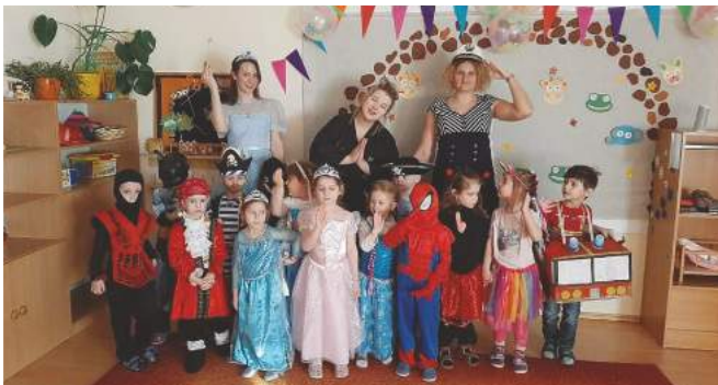
Kiseb és Nagyobb jelmezesek a Maci csoportban