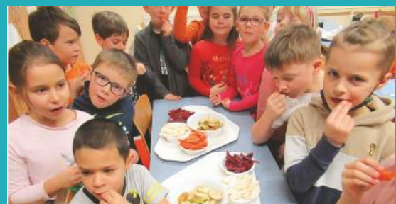
A friss vitamint kóstol(gat)ók