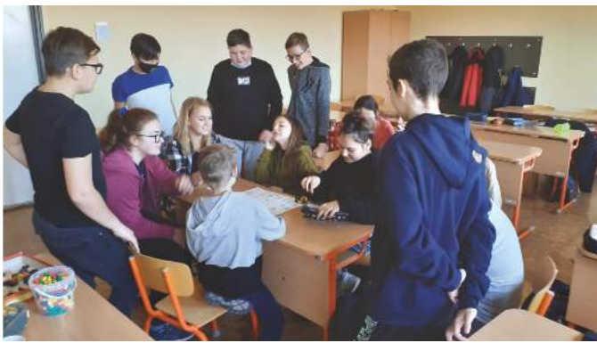
Az 5/a, 7/a és 7/b osztályos diákok a foglalkozás közben

2020 novembere és 2021 januárja között iskolánk 7.a, 7.b és 5.a, b osztályos tanulói közül tizenöten vettek részt a KOR-társ BAJ-társ projektben. A foglalkozásokon a tinédzserek jellemző, mindennapi gondjait-bajait tártuk fel közösen a résztvevőkkel. A foglalkozásokon a különböző témák feldolgozásán keresztül igyekeztünk megoldási javaslatot nyújtani, segíteni egymásnak.