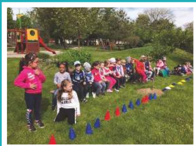
Felkészülés a meccsre és a szurkolásra