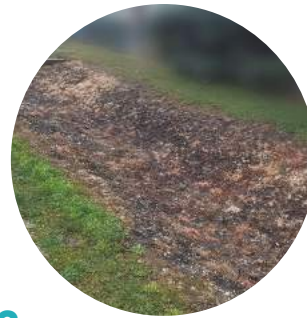
Ha most ilyen...