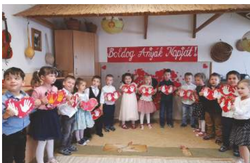
A Katica csoportosok is köszöntötték az Édesanyákat