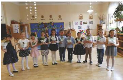
Anyák napja a Halacska csoportban