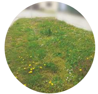
de lehetne ilyen is!

Állítólag Dél-Amerikában favágók pusztítják a természetet. Évente sok ezer hektár esőerdőt vágnak ki, gazdasági haszon reményében. Azt is mondják, hogy azok az erdők a Föld tüdeje. Élőviláguk rendkívül változatos és még a Föld klímájára is jelentős befolyással vannak. A favágók iszonyat kárt okoznak azzal, hogy ezt a kánaáni, buja élővilágot lekopaszítják. Ezt állítják. Én nem tudom, még sosem jártam Dél-Amerikában.