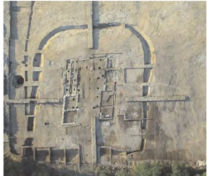
2.kép: Légifelvétel a gönyői ásítás helyszínéről

Így már értjük, miért nem érte váratlanul a kutatókat a 2007-es beruházás kapcsán előkerült római kori épület, mely egy kis dombon épült Gönyű, jelenleg Nagy-Sárosnak elnevezett részén. A munkálatok során a régészek egy kőalapozású, vályogfalas épület alapjait tárták fel, melyet egy nagyobb kerítőárok vett körül. A bejáratához közel 4 da-