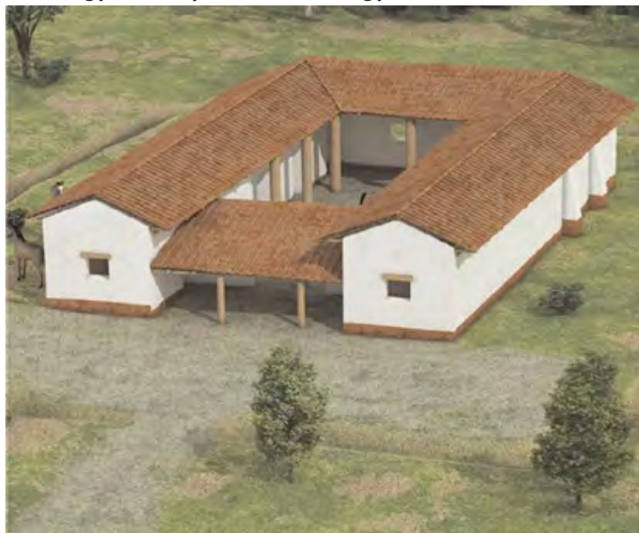
3.kép: A Gönyűn feltárt épület 3D rekonstrukciója (készítette: Pazirik Kft.)

rab, körülbelül 4 méter mély kút szolgáltatva, melyeknek egyikéből még egy belesett korsó is előkerült. Feltárással került számos konyhai cserépedény, szandálszeg, övveret, fibula (ruhakapocstű) és vaskés, érdekesebb leletként említik a házikedvencként tartott, itt eltemetett kutya sírját, egy keréknyomot, illetve egy kulcsot is.