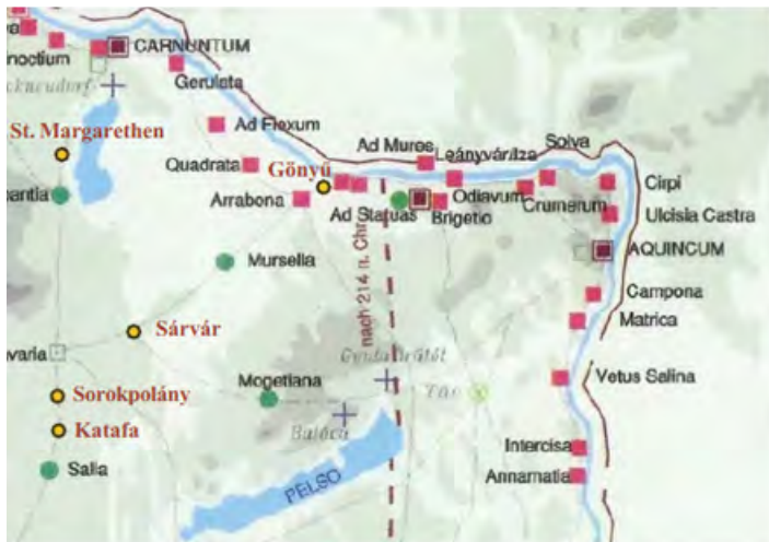
1.kép: A római limes magyarországi szakasza

A kérdések megválaszolásához vissza kell repülnünk közvetlenül a Krisztus születése utáni időkbe. Ekkortájt a Római Birodalom többek között szinte egész Európát magában foglalta. A mai Magyarország teljes nyugati része a Birodalom Pannónia nevű provinciájához tartozott, sőt a Duna folyó vonalának köszönhetően annak egyik legfontosabb európai határszakasza volt.