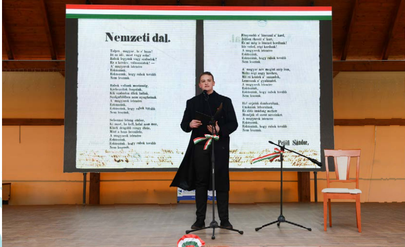
A március 15-i ünnepség fotóit készítette: Dr. Nagy Gergely

Szász-Pungur Csenge közművelődési referens