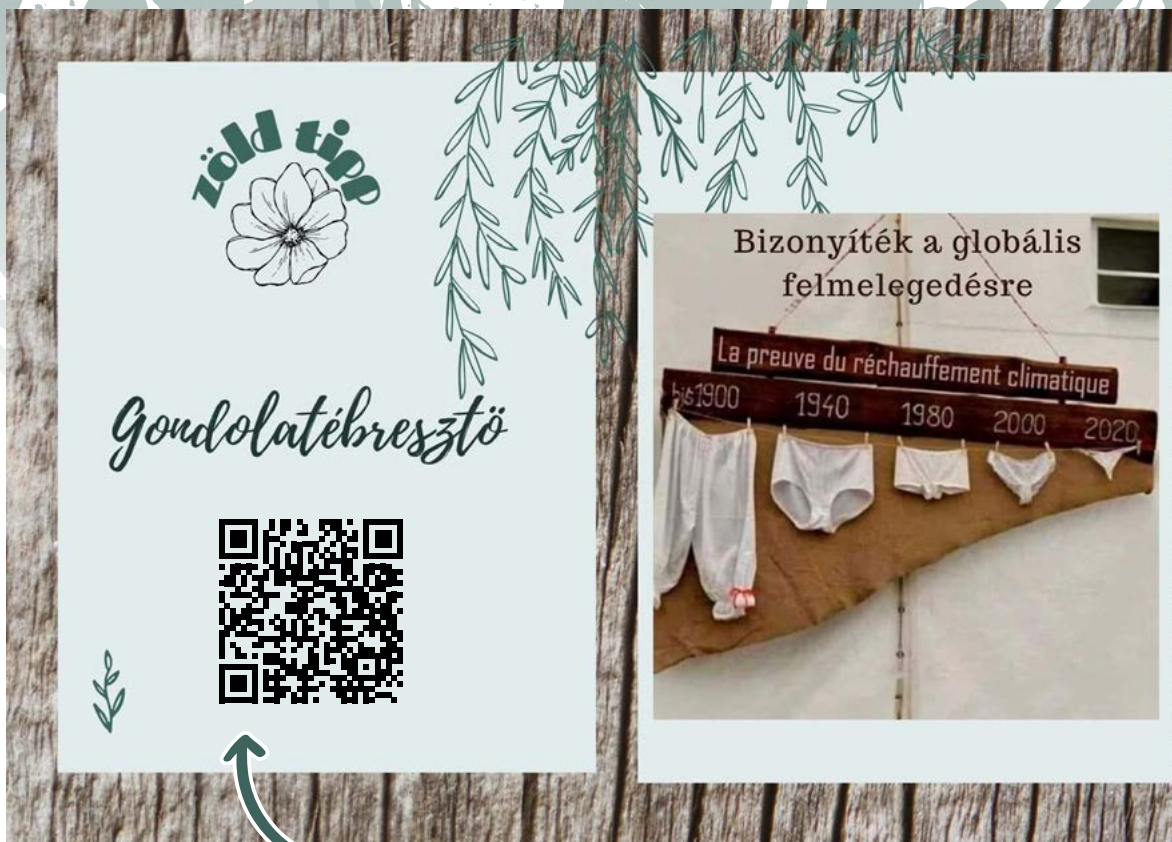
A QR-kód egy „Gondolatébresztő” videót rejt! Készítette: Baráth Kinga Ha van egy kis időd, nézd meg! ☺