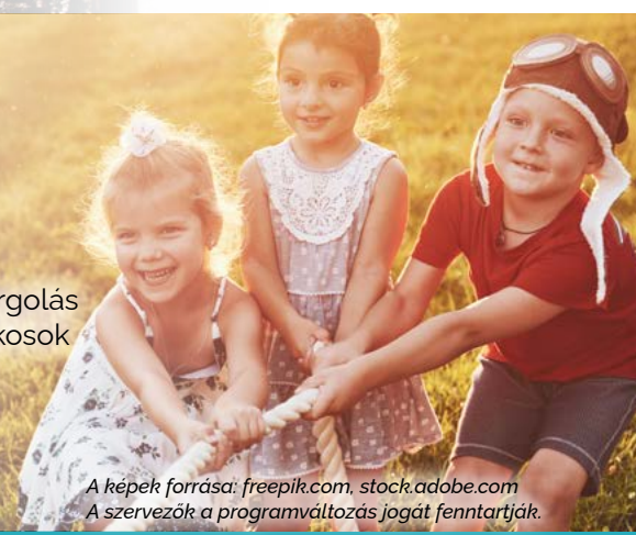
A képek forrása: freepik.com, stock.adobe.com A szervezők a programváltozás jogát fenntartják.