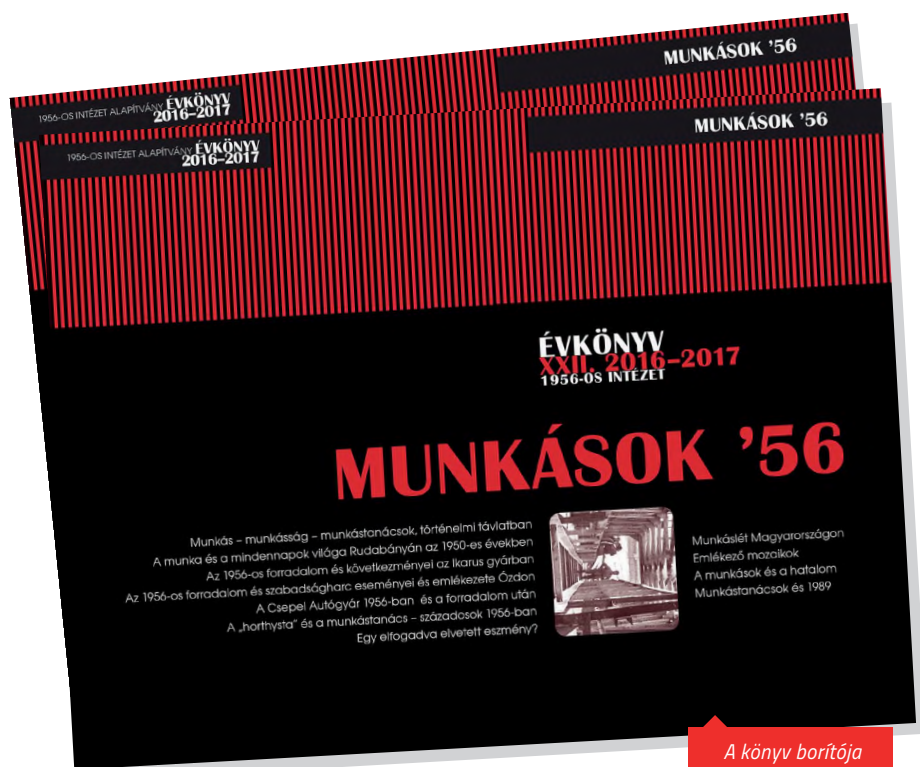
A könyv borítója

felszereltsége kifejezetten jó körülményeket jelentett az ott élő szakmunkásoknak és csoportvezetőknek. A szerző felhívja a figyelmet a második világháborút követő, a polgári-paraszti, illetve városi kispolgári lakáskultúra megjelenésével feltűnő, immár fürdőszobával felszerelt munkáslakások terjedésére is.