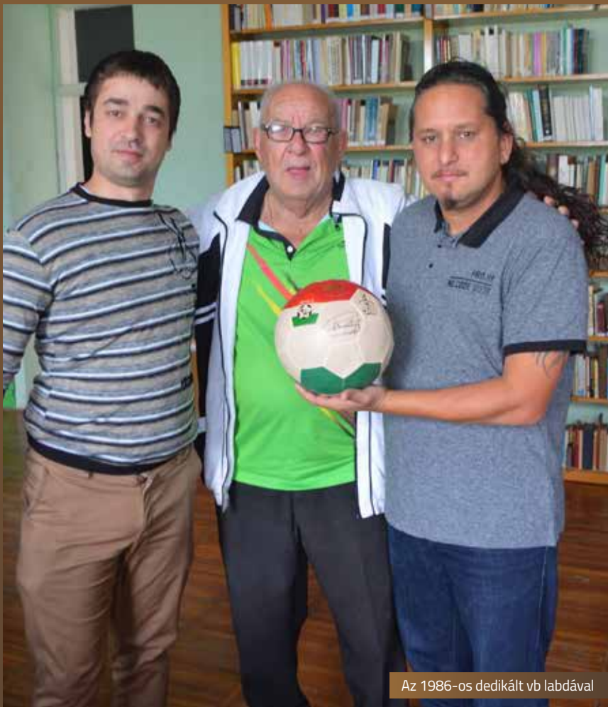
Az 1986-os dedikált vb labdával