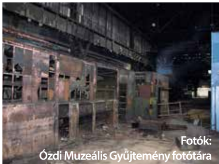
Fotók: Ózdi Muzeális Gyűjtemény fotótára

Másoknak maga volt az élet. A nyüzsgő gyár. A füstöt okádó kémények, az izzó acél, a hömpölygő embertömeg, bimbózó szerelmek, a munka után megivott kisfröccsök, a fiatalság. A munka, a kenyér. Nekik nem csak egy rakás fém. S mikor azt látják, hogy tönkre teszik, szétlopják, mintha a szívükből tépnének ki egy darabot.