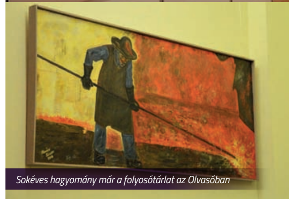
Sokéves hagyomány már a folyosótárlat az Olvasóban