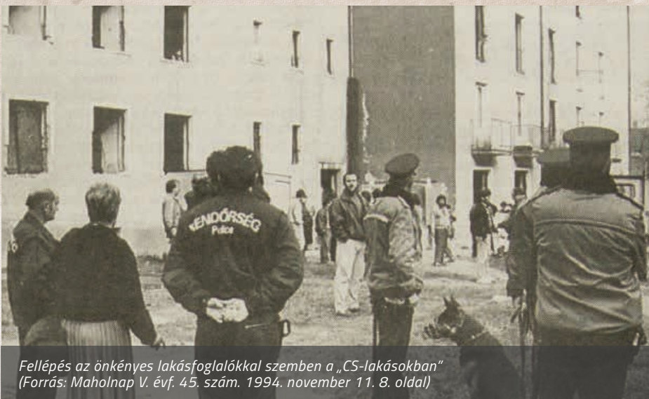
Fellépés az önkényes lakásfoglalókkal szemben a „CS-lakásokban”

Az úgynevezett csökkentett komfortfokozatú „CS-lakások” építése országosan az 1960-as évek elejétől kezdődött, amikor egy állam által támogatott, előkészítetlen program a cigánytelepek felszámolását célozta meg. 1961-ben az MSZMP Politikai Bizottsága a kérdés megoldását az erőltetett beolvasztásban látta, amelynek eredményeképpen tíz év alatt (1965-1975) mintegy 13 ezer család költözött új építésű, vagy megfelelő ingatlanba. A rendszerint egy tömbbe épített lakások