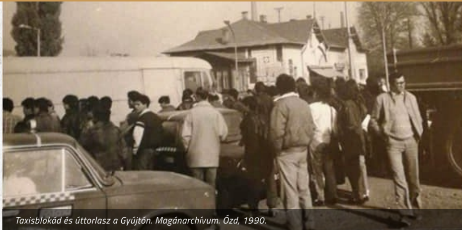
Taxisbloká és úttorlasz a Gyűjtőn. Ózd, 1990.

A rendszerváltás utáni első szabad október 23-i ünnepség után két nappal kiábrándítóan hatott a hivatalos bejelentés: a kormány 65%-kal, 56 Ft-ra emeli a benzín literenkénti árát, miután az olaj világpiaci ára megduplázódott az öbölháború, illetve a szovjet olajszállítás akadózása miatt. A családás egyik fő kiváltó oka nem is annyira a brutális mértékű áremelés volt, sokkal inkább az, hogy a korabeli hivatalos kommunikáció végig tagadta, hogy a kabinet