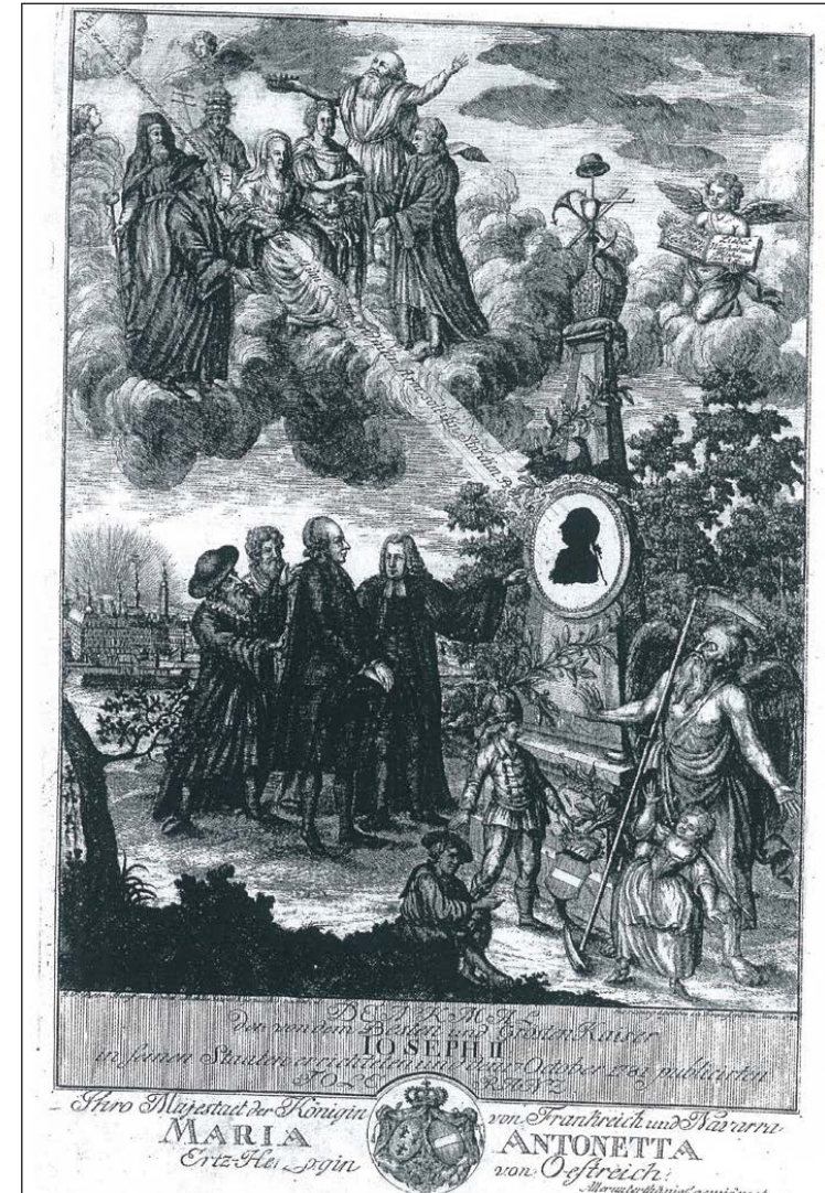
A tolerancia allegóriája