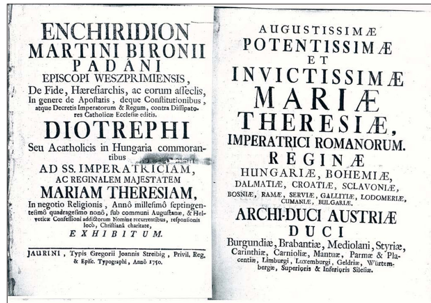
Az Enchiridon és annak dedikációja (a szerző tulajdona)