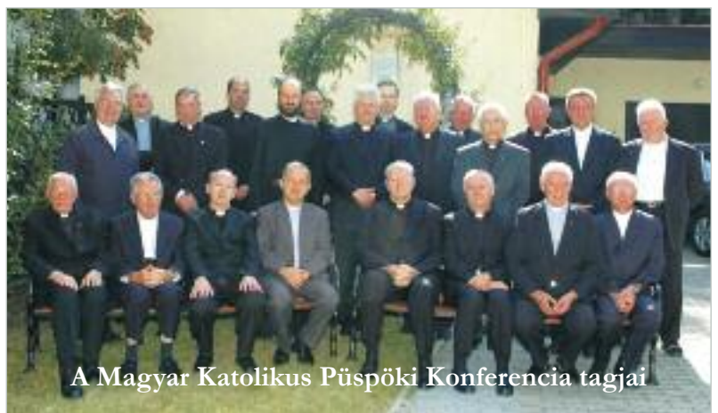
A Magyar Katolikus Püspöki Konferencia tagjai

Egyházunk a Jézus Krisztustól kapott küldetése szerint továbbra is hirdeti az örömhírt, szolgálja a békét, a kiengesztelődést és a köz javát.