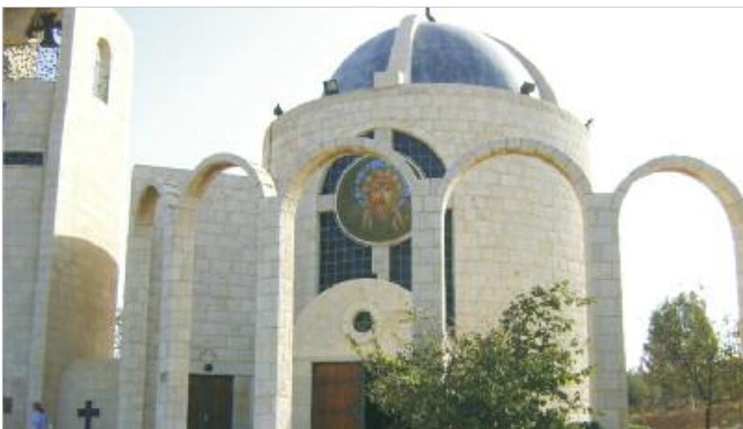
A damaszkuszi Tal Kawkab városrészben található ortodox Látomás temploma

Visszatérve Damaszkuszba, megemlékezünk még Damaszkuszi Szent Jánosról, Antiochiai Szent Ignácra és Edesszai Szent Efrém diakónusról. E két város ma török területen található. Szent Pál, védelmezd továbbra is Krisztus Egyházát!