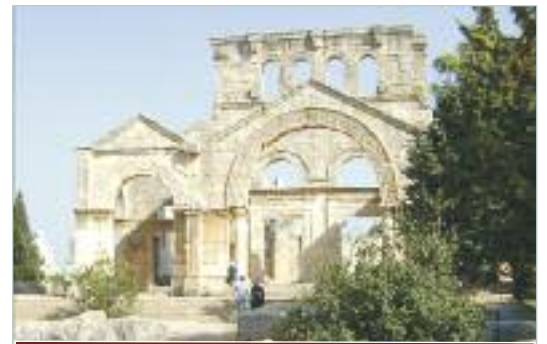
Oszlopos Szent Simeon temploma

A sivatagban, Deir Samaanban található Oszlopos Szent Simeon temploma. A 4. században épült, akkor a világ legnagyobb szentélye volt, 88x108 méteres romjaival ma is csodálatos. Meghatottan prédikáltam itt, mert kisgyermek koromban olvastam a szent élettörténetét, most pedig lenyűgö-