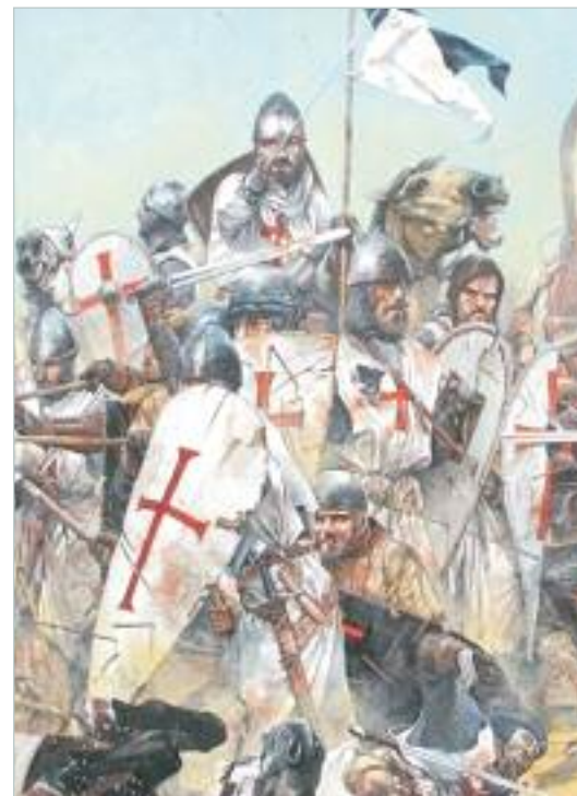
Templomos lovagok harc közben

Az érem másik oldala, hogy a közel 200 évig tartó háborúk során a keresztes seregekbe beépültek olyan emberek is, akiket nem a hit és a Szentföld iránti buzgalom vezetett, hanem a kalandvágy, a meggazdagodás és sok esetben maga a gonoszság is. Zsoldosok, közönséges gyilkosok is csapódtak ehhez a sereghez, amely már Magyarországon áthaladva is fosztogatott Könyves Kálmán idejében. Rövid időre sikerült visszafoglalni a Szentföldet, az emberi gyengeség jelei azonban ekkor is megmutatkoztak. A földszerzés, az irigység annyira elvakította a katonákat, hogy a nagyobb tulajdon reményében gyilkolni, rabolni kezdtek. Az erkölcsi züllés miatt