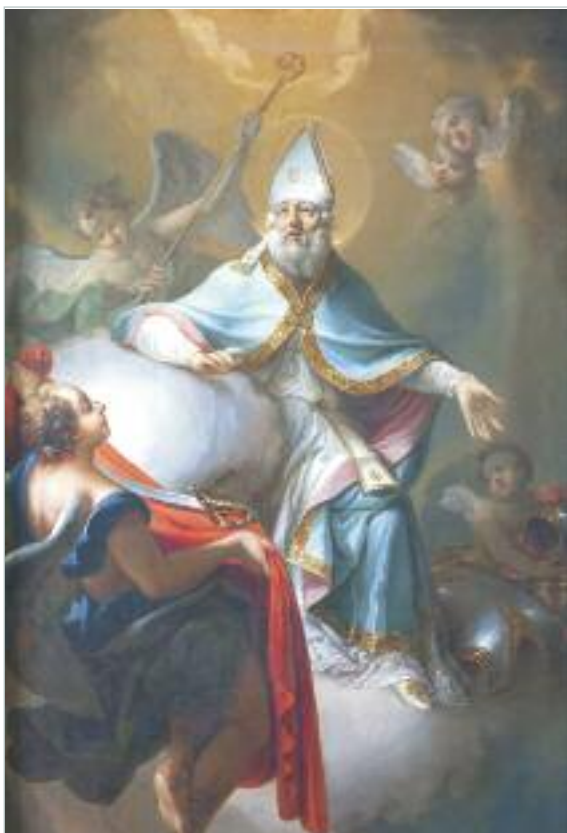
Szent Márton megdicsőülése Dorffmaister István festménye

Márton Pannonia Sabaria nevű városában született, majd az itáliai Ticinumban (Pavia) nevelkedett. A világi méltóság szerint szülei nem származtak alacsony sorból, azonban pogányok voltak. Apja először közkatoná, majd tribunus lett. Ifjúkorában Márton is katonának állt. Constantinus uralkodása idején a testőr csapatok tagja lett, később Julianus császárnak szolgált. Nem önként, mivel e kiváló ifjú gyermeksege szinte első éveitől kezdve Isten szolgálatára vágyódott. Szülei akarata ellenére már tízéves korában egy templomba menekült, és kérte, hogy katekumen lehessen. Majd csodálatos módon teljesen Isten szolgálatára adta magát, és midőn tizenkét éves lett, a pusztába kívánkozott. Követte volna vágyát, de éveinek csekély száma megakadályozta tervét, lelkét azonban remeteségek vagy templomok foglalkoztatták, és már gyermekkorában azon elmélkedett, amit később alázatos buzgósággal megvalósított.