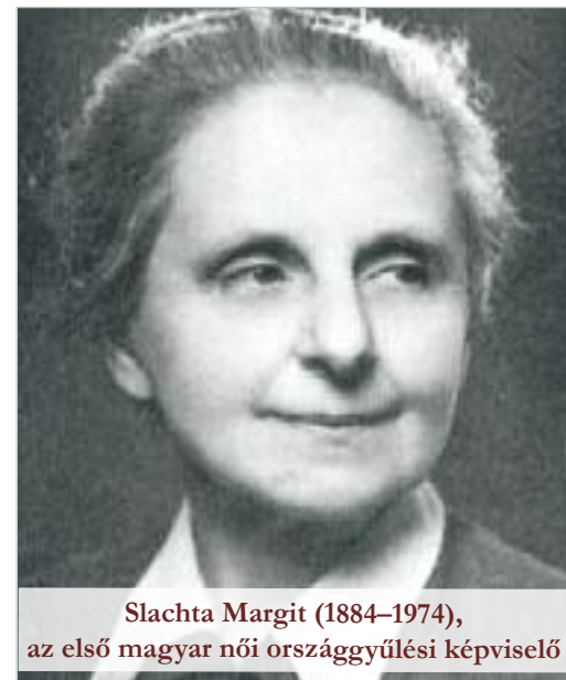
Slachta Margit (1884–1974), az első magyar női országgyűlési képviselő

sület – amely egyébként annak idején a Szent Erzsébet Egyesület tagjaiból vált ki – égisze alatt. Idősebb hölgyek, patronázsok felügyelték a lányokat, játszottak, tanultak velük, illetve gondoskodtak lelki nevelésükről is. Mária kongregációt alapítottak számukra, s a Mária kongregáció keretén belül gyakorta – mint ahogy az általunk fellelt cikk is tárgyalja – műsoros délutánokat szerveztek, amelynek bevételét egy Mária-szoborra kívánták fordítani.