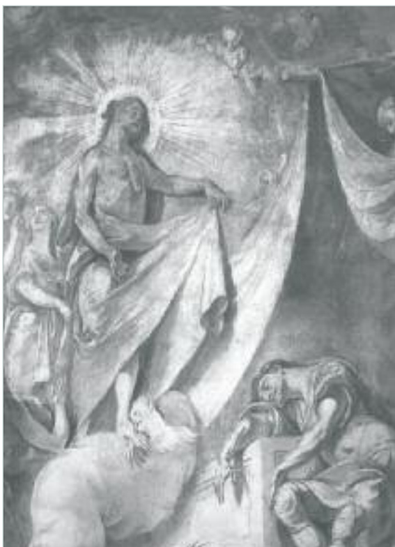
Szent Márton álma (freskó) J. Winterhalder, 1800 szombathelyi Székesegyház (1945-ben elpusztult)

E szent ember a látomása után sem vágyódott hiú emberi dicsőségre, hanem tettében Isten jóságát ismerte fel, és midőn tizennyolc éves lett, megmerítkezett a keresztség vizében. A katonaságot azonban nem hagyta el rögtön, mert engedett tribunusa kérésének, akinek jó barátja és lakótársa volt, s aki megígérte Mártonnak, hogy tribunusi ideje lejártával ő is lemond a világról. Márton e reményben bár csak névleg, még majdnem két évig katonáskodott megkeresztelkedése után.