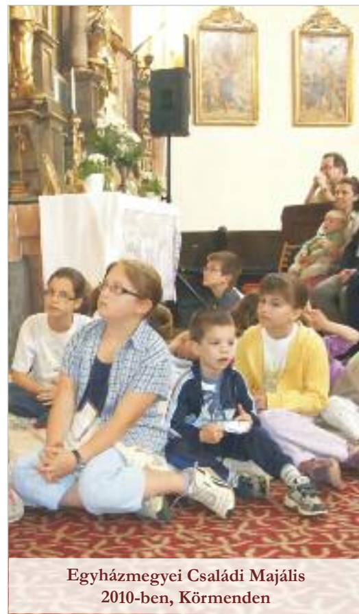
Egyházmegyei Családi Majális 2010-ben, Körömden

Egyházunk évezredes, letisztult tanítása hosszú vezérfonalként fut végig életünkön. Családjaink, családcsoportjaink, egyházközösségünk, ezekre a fonalakra tud rákapcsolódni. Olyan ez, mint egy 2000 éve folyamatosan készülő színpompás szőnyeg. Minden kor a maga gazdagságát, mintázatait, motívumait tudja díszítésként hozzáadni. Az Egyház pedig szentségei, szentelményei által megvédi, felvértezi a hozzá