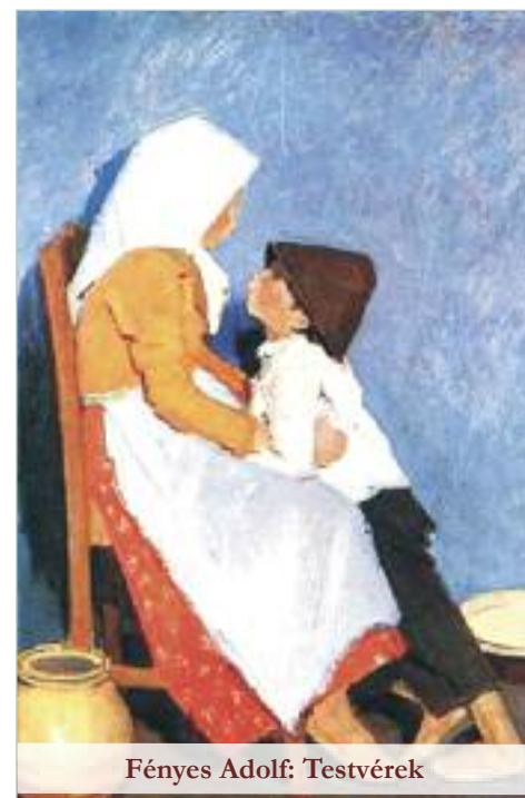
Fényes Adolf: Testvérek

A testvérünket nem kell szeretnünk, mégis szeretjük. Ez alapvető, még ha az illető sok hibát is követett el, vagy vétett ellenünk. A szeretet, a szüleink, közös életünk köt össze minket. Nem lehet nem szeretni őt. A világon a legalapvetőbb dolgok egyike a testvérünk iránt érzett szeretetünk, ragaszkodásunk. (Lilla)