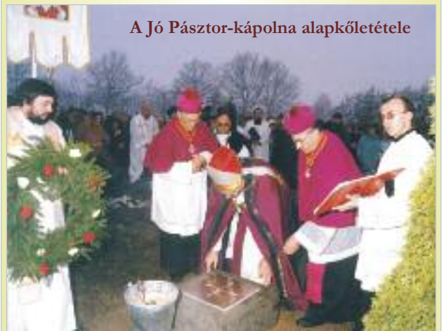
A Jó Pásztor-kápolna alapkövetétele