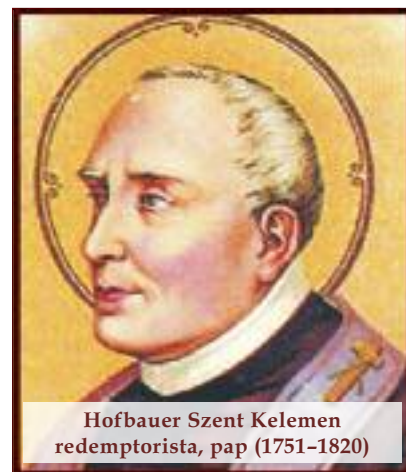
Hofbauer Szent Kelemen redemptorista, pap (1751-1820)

Nehéz gyermek- és fiatalokora után úgy tűnt, nem érheti el nagy vágyát, hogy pap lehessen. Kitanulta a pék mesterséget, amivel egy kis pénzhez juttatta családját, és el tudta kezdeni tanulmányait. Beállt remetének, akik ebben az időben a papokat a hitoktatásban és a különféle plébániai munkákban segítették. Bécsbe ment, hogy ott jobban elmélyítse a hitoktatáshoz szükséges hitbéli tudását. Jó szándékú emberek segítették, hogy pappá nevelődhessen, de a teológián ekkor már olyan jozefinista professzorok tanítottak, akik sokszor már nem a katolikus tanítást adták tovább, ezért barátjával Rómába ment, ahol beléptek a nem sokkal korábban alakult redemptorista rendbe. A fogadalom és a papszentelés után a rend vezetése visszaküldte őket Ausztriába, hogy ott is alakítsák meg a rendet, de ezt az állam nem en-