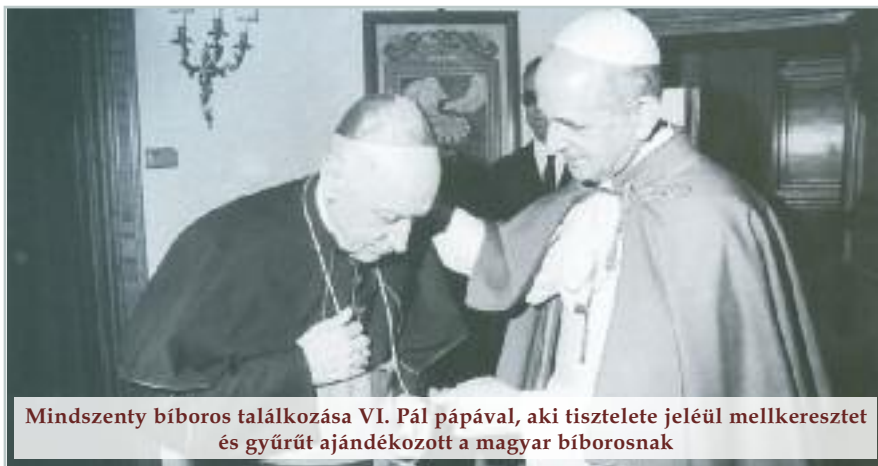
Mindszenty bíboros találkozása VI. Pál pápával, aki tisztelete jeléül mellkeresztet és gyűrűt ajándékozott a magyar bíborosnak

Legyen Krisztus a mi nagyböjti útítársunk, aki végigjárta az emberi élet útját, s akinek keresztútja a halálán át a feltámadás dicsőségébe vezetett!