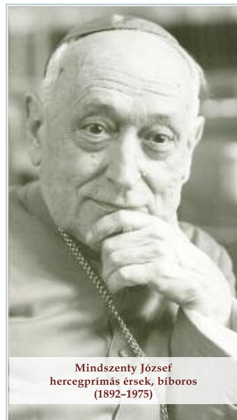
Mindszenty József hercegprímás érsek, bíboros (1892-1975)

Budapesten, az Andrassy út 60. épületére ma ez van kiírva: „ Ebben a házban kínozták Mindszenty József bíboros hercegprímást, esztergomi érseket. ” Alatta tovább olvasható: „ A gyilkosoknak megbocsáthatsz, de az áldozatokról megemlékezz. ” Mindszenty József katolikus hitéért és a magyar nemzetéért eleven áldozattá vált. Ma már nincs vasfüg-