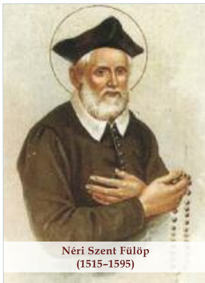
Néri Szent Fülöp (1515–1595)

Úgy gondolom, az Új Evangélicizáció Évében a katolikus közösségeknek is ehhez hasonló krisztusi derűtől sugárzó irányba kell elmozdulnia, amelynek a szentségi élet és az imádság az alapja.