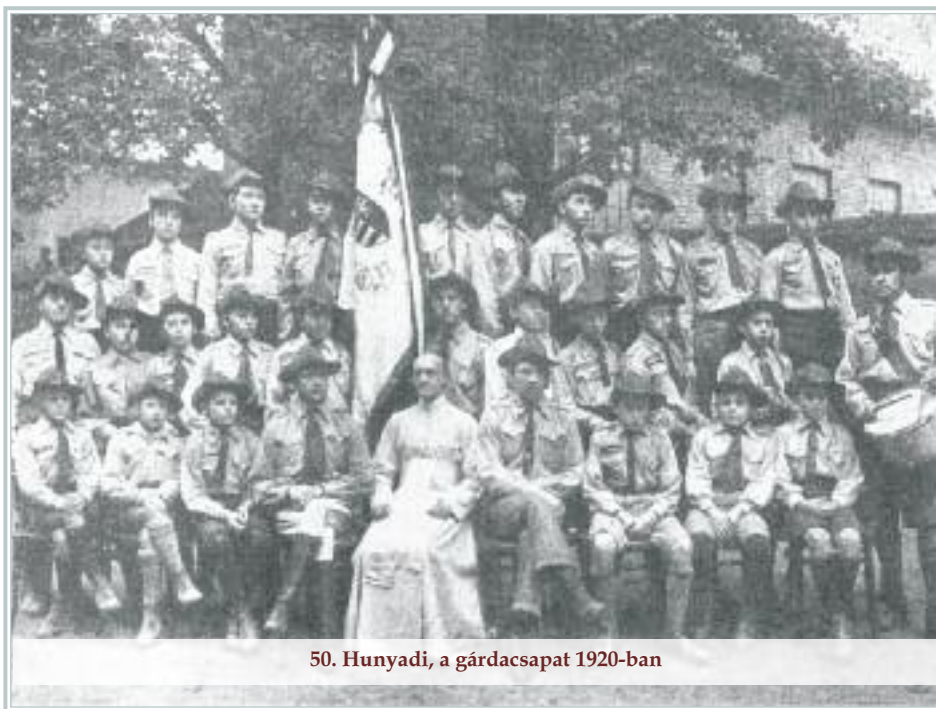
50. Hunyadi, a gárdacsapat 1920-ban