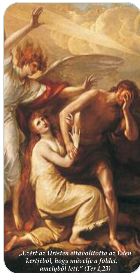
„Ezért az Úristen eltávolította az Éden kertjéből, hogy művelje a földet, amelyből lett.” (Ter 1,23)

A problémát tovább fokozza az önfejlés, kitarunk még a rossz dolgok mellett is, büszkén állítjuk, hogy meg tudjuk magunkat valósítani ebben a világban. Állítjuk, hogy némi jó szándékkal és összefogással megteremthetjük mi magunk az Édent ezen a földön