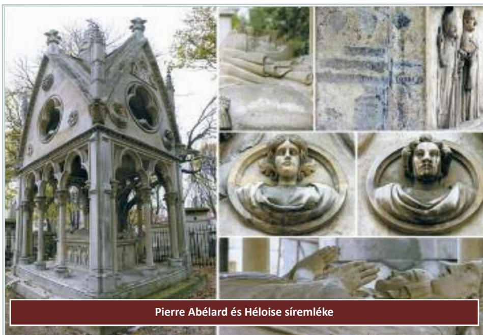
Pierre Abélard és Héloïse síremléke

Mi pedig lelkünket emeljük azalatt, s vágyaink mind e szent hon felé szálljanak, hogy Jeruzsálembé Babilonból vidám szívvel térjünk meg a számkivetés után. Ott minden bús teher levetve boldogan Sionnak énekét daloljuk gondtalan, s malasztodért örök hálákat zeng Neked, mi Urunk, Királyunk, üdvözült nemzedet! Mert ott a szombatot új szombat váltja fel, szombatolók örök ünnepé nem fogy el, s nem érik végüket az ujjongó dalok, amiket harsogunk mink és az angyalok.