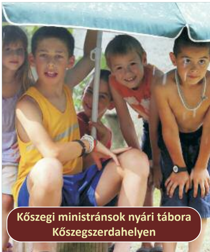
Kőszegi ministránsok nyári tábora Kőszegszerdahelyen

▲ Tizenkilenc ministráns indult július 4-én Kőszegről Kőszegszerdahelyre. A táborozók a szállás elfoglalása előtt rövid pihenőt tartottak Cákon, és a tábor ideje alatt ellátogattak Velembe is, ahol szentmisén vettek részt.