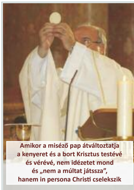
Amikor a miséző pap átváltoztatja a kenyeret és a bort Krisztus testévé és vérévé, nem idézetet mond és „nem a múltat játssza”, hanem in persona Christi cselekszik

Az Eucharisztia ünneplésének közös „isteni és emberi akciójába” történő felvétel a keresztény beavatásban valósul meg, ami mindenekelőtt ajándék nekünk, megkeresztelteknek. Ám nemcsak ajándék, hanem életre szóló feladat is, hogy a célt, a Jézussal való élő közösséget a kenyértörésben mindig megéljük és erre másokat is elvezessünk. [Dr. Németh Norbert]