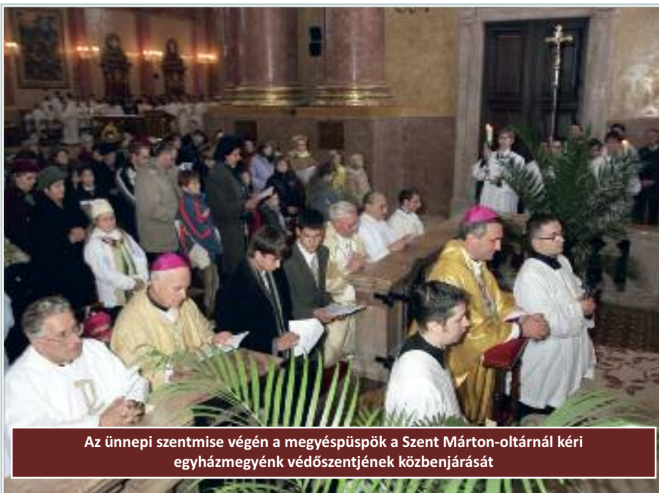
Az ünnepi szentmise végén a megyéspüspök a Szent Márton-oltárnál kéri egyházmegyénk védőszentjének közbenjárását

Egyszer az ördög egy ökör véres szarvát tartva kezében, hatalmas robajjal tört be a szobájába. Majd véres jobbát mutatva ezt mondta neki, miközben a legújabb gonosztettének örvendezett: „ Hol van a te erőd, Márton? Éppen most öltem meg valakit a teid közül! ” Erre Márton összehívta a testvéreket, és elmondta, hogy mit közölt vele az ördög. Megparancsolta nekik, hogy gondosan nézzenek be minden cellába, és tudják meg, kivel történt ez a baj. Jelentették neki, hogy a szerzetesek közül senki sem hiányzik, de egy pénzért felfogadott parasztember kiment az erdőbe, hogy szekerevel fát hozzon. Ekkor megparancsolta, hogy néhányan menjenek ki, és keressék meg. Nem messze a kolostortól meg is találták, már alig volt benne élet. Miközben még utolsókat lélegzett, elmondta a testvéreknek, mi okozta halálos sebé: mikor a járomban levő ökreinek meglazult szíjait szorosabbra akarta fűzni, az egyik ökör kiszabadította fejét, és szarvaival a lágyékába döfött. Kis idő múltán a parasztember meg is halt. Rád van bízva, hogy megértsd, milyen isteni ítéletből származott ez az ördögnek adott hatalom. Mártonban csodálatra méltó volt, hogy nem csupán az elmondott történetet, hanem az ehhez hasonló, Istentől tudomására juttatott összes előforduló esetet jóval korábban előre látta, sőt a testvérekkel közölte is őket.