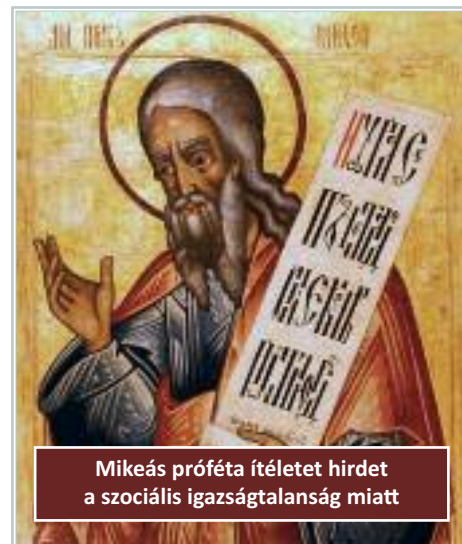
Mikeás próféta ítéletet hirdet a szociális igazságtalanság miatt

Ezért villámcsapásként hatottak Mikeás szavai a hamis biztonságra építők számára: „És még az Úrban bizakodnak! Azt mondják: Nem közöttünk van az Úr? Nem érhet minket semmi veszedelem. Bi-