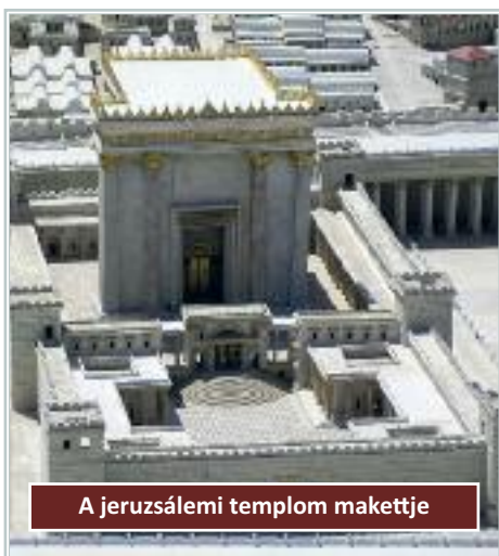
A jeruzsálemi templom makettje

teletben részesíti Betlehemet, a Jeruzsálemtől délre mintegy 7 kilométerre lévő falut. Betlehem Dávid hazája. Ott született, ott nevelkedett, és őrizte a nyáját. Meghívást kapott, mint Izrael jövőbeli királya (1 Sám 16). Jeruzsálem tette királysága vallási és politikai központjává és az lett „Dávid városa”. Betlehemet elfeledték. Mikeás megadja neki az őt megillető helyet: Jeruzsálem csak Dávid fővárosa, de Betlehem az ő hazája. Mikeás emlékeztet a helységhez fűződő reményre: „De te Betlehem Efrata, bár a legkisebb vagy Juda nemzetiségei között, mégis belőled születik majd nekem, aki uralkodni fog Izrael felett... Ezért elhagyja őket az Úr, míg nem szül, akinek szülnie kell ... Ő maga lesz a béke” (5,1-4).