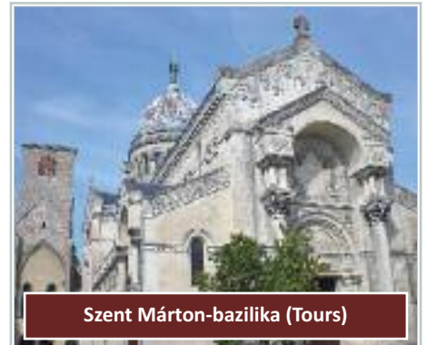
Szent Márton-bazilika (Tours)