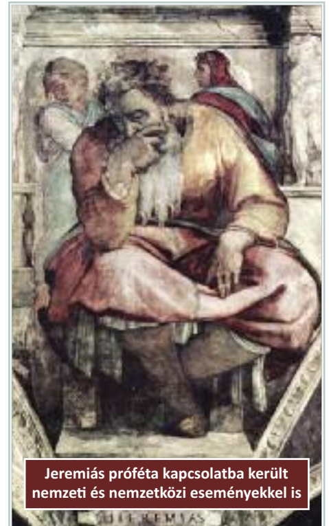
Jeremiás próféta kapcsolatba került nemzeti és nemzetközi eseményekkel is

A prófétára nem hallgattak. Egy elszakadási kísérlet miatt megérkezett Nabukodonozor seregével, s Jeruzsálemet másfél évi ostrom után másodszer is bevette. Az ostrom alatt a prófétát azzal vádolták, hogy demoralizálja az ellenállókat. Börtönbe zárták, ciszternába dobták, és csak az utolsó pillanatban szabadult ki egy néger rabszolga segítségével. Amikor a helyzet teljesen reménytelen lett, Jeremiás megpróbált bátorságot önteni a népbe, és örök szövetséget hirdetett meg Isten és a nép között. Ez az ő üzenetének a csúcsa. (Jer 37,11-21; 38,1-13; 32,36-44).