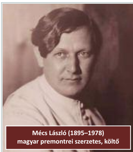
Mécs László (1895–1978) magyar premontrei szerzetes, költő