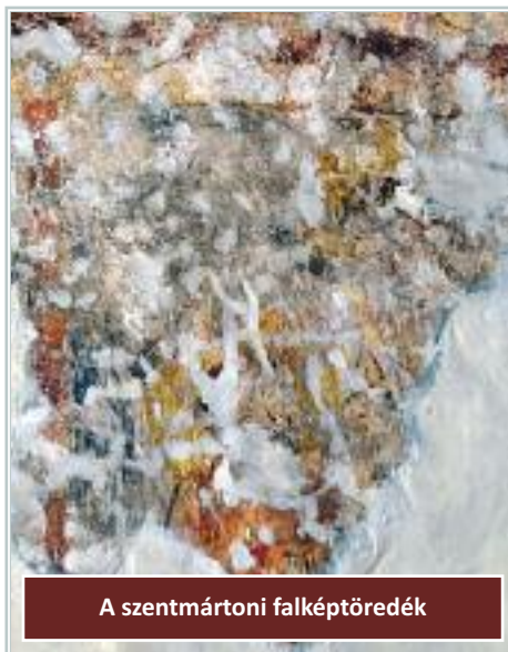
A szentmártoni falképtöredék

A magyarországi gótikus templomfestészetben a Jézus gyermekségét megjelenítő ciklusból kétség kívül a „ Királyok imádása ” volt a legkedveltebb, amely gyakran vonulások ábrázolását is magában foglalta (lásd példaként a Vas megyei Velemér templomát). Ez a népszerűség pedig annak tudható be, hogy a Magyarországról az idő tájt igen gyakran Aachenbe induló zarándokok útjuk során érintették a kölni dómot is. Ott pedig megcsodálhatták a háromkirályok ereklyéit, amelyeket 1164-ben I. (Rótszakállú) Frigyes német-római császár vitetett oda Milánóból. [Kiss Gábor]