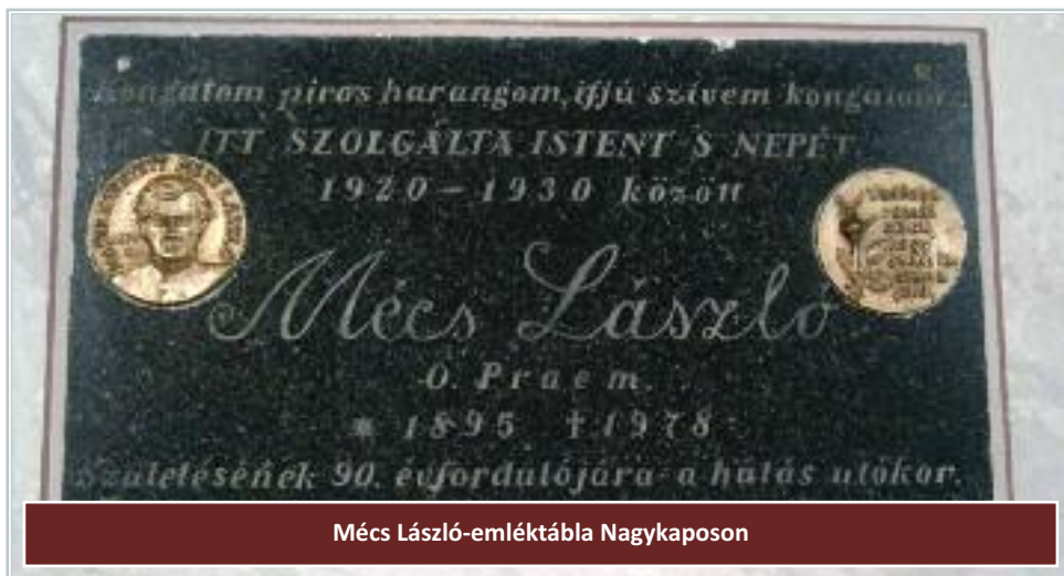
Mécs László-emléktábla Nagykaposon