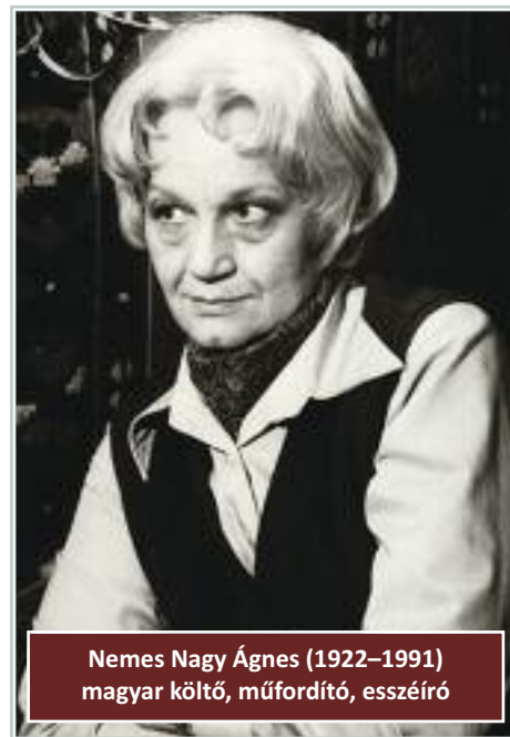
Nemes Nagy Ágnes (1922–1991) magyar költő, műfordító, esszéíró

Egyes elemzők szerint a tetszhalál az ötvenes években elhallgatni kényszerülő írókra vonatkozik, azokra, akik nem voltak hajlandók az akkori politikai rendszert szolgálni munkáikkal. Az évtizednyi mellőzöttség, a pálya megtörése, az önbizalomvesztés után kellett újra megszólalniuk, érvényes