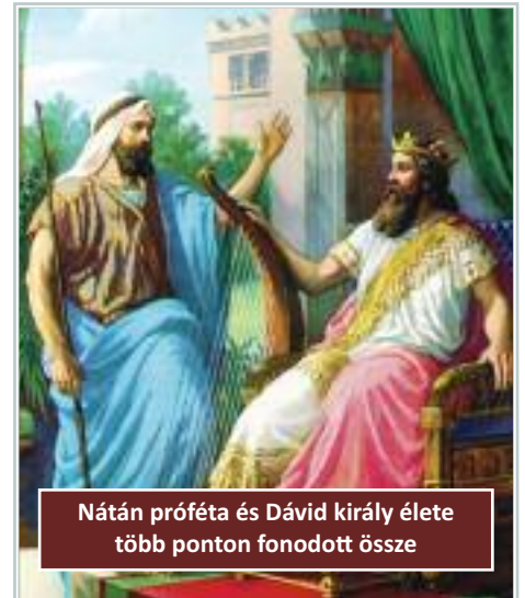
Nátán próféta és Dávid király élete több ponton fonódott össze

Ekkor avatkozik be Nátán. Bemegy Dávidhoz, és elmondja: „Egy városban élt két ember. Az egyik gazdag volt, a másik szegény. A gazdagnak rengeteg juha, kecskéje és barma volt. A szegénynek azonban nem volt egyebe, csak egy kis báránya, vette magának. Etette, úgy hogy megnőtt, vele magával és gyermekeivel élt. Evett a kenyérből és ivott a poharából. Az ölében aludt, s olyan volt, mintha lánya lett volna. Egyszer vendég érkezett a gazdag emberhez. De nem tudta rászánni magát, hogy a juhait vagy barmait közül egyet is elvegyen, és a vendégnek, aki érkezett, elkészítse. Ezért elvette a szegény ember báránykáját, és azt