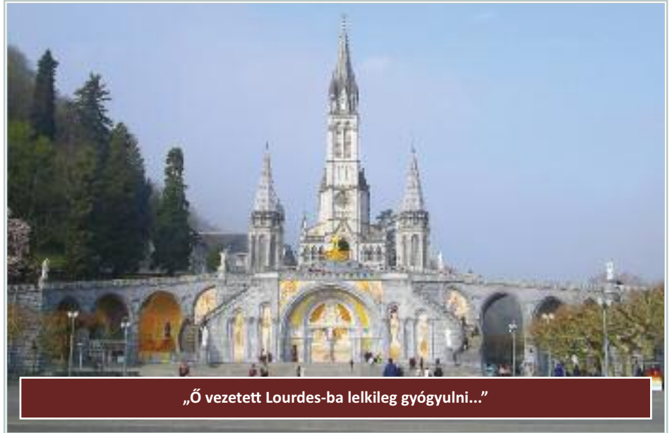
„Ő vezetett Lourdes-ba lelkileg gyógyulni...”

A következő évi lelkigyakorlaton a nővér – látva lelki gyógyulásomat –