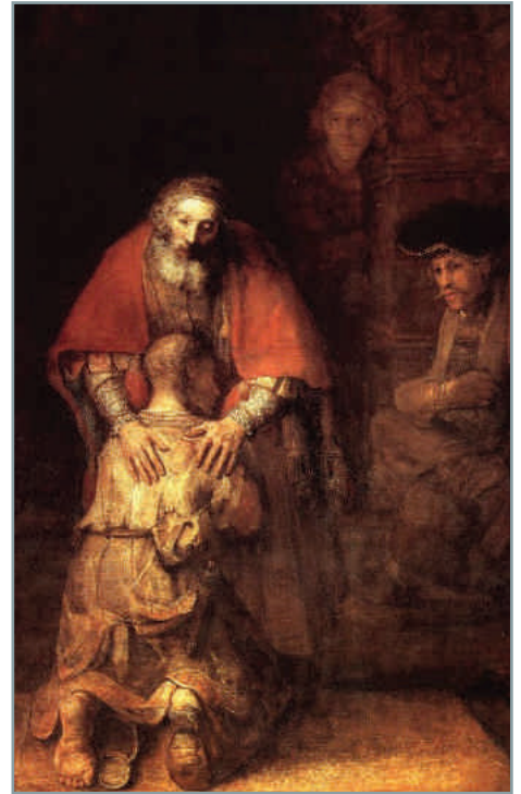
Rembrandt: A tékozló fiú hazatérése (1668-1669 körül)

A bibliai parafrázis címében különös a „novella” műfaji megnevezés, a szö-