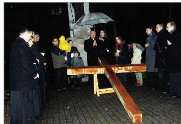
2014. április 18. - Szombathely város keresztútja