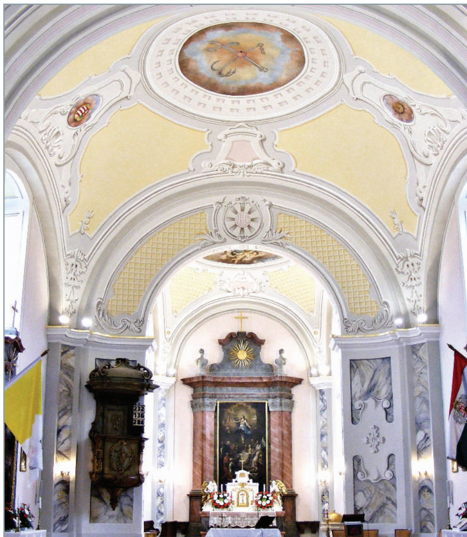
Nógrád, római katolikus templom